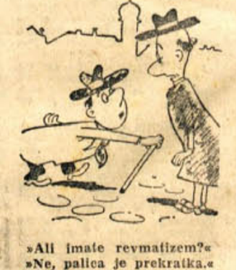
»All imate revmatizem?« »Ne, palica je prekratka.«

Ibro se je vrnil iz Stambula (Carigrada) pa pripoveduje vaščanovo lepote in čuda tega mesta. »Ampak vse to je ni, v primeri z njihovo Alajbegovo džamijo. Zvonik je tako visok, da se nebu pod oblake. Če z vrha vržeš na tla kladivo, mu ročaj segne prej, kot pade na zemljo.»