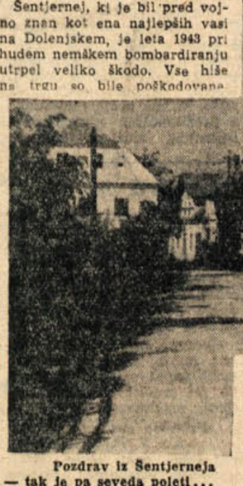
Prozvir iz Sentjerneja — tak je bil sedva početil...

Sentjerne, ki je bil pred vojno znan kot ena najlepših vasi na Dolenjskem, je leta 1943 pri hudem nemškem bombardiranju utrpel veliko škodo. Vse hiše na trgu so bile poškodovane. dve pa sta povsem izginiti. Po vojni so bile sicer odstranjene ruševine, hiše pa popravljene le toliko, da so bile uporabne za bivanje. V zadnjih dveh letih Sentjerne mnogo gradi in postaja tako vedno lepši in večji. Vse hiše na trgu so popravljene, za cerkvijo je občina zgradila lepo pokrožno stopnišče, pred poslopjem nižje gimnazije je urejen cvetlični nasad in ograjen z lepo, novo ograjo; dozidan; sta poslopij gospodarske uprave in kmetijsko-gospodarske šole, pod streho je novi gasilski dom, privrtniki pa so dogradili nad deset večjih in manjših stanovanjskih hiš. Mnogi umni gospodarji so k svojim pritičnim kmetijskim hišam zidali prednja vhodna vrata in si namesto nepotrebne, široke veže uredili na tem prostoru manjšo vežo in lepo sobo s širokim tridelnim oknom. Tako preurejene in na novo pobejene hišice so sedaj zelo udobne in lične. Splošna želja vseh Sentjernejanov je še, da bi čimprej zidali novo, tako nujno potrebno šolsko poslopje in da bi prazen prostor na trgu preuredili v park s spomenikom padlim borcem in talecm. Ko bo urejeno še to in ko bodo zrasle na novo posajene lipe in topoli, bo vsak, ki bo po ceplj asfaltirani cesti prišel skozi našo vas, lahko upravičeno rekel: »Lepega kraja ne, kot je Sentjerne!« V.