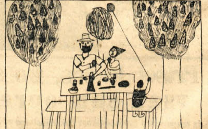
Otrok je odkril, taka je zato tudi njegova risba. Ivan Slapničar: NA VRTU (novomeška gimnazija)