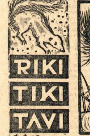
Po R. Kiplingu