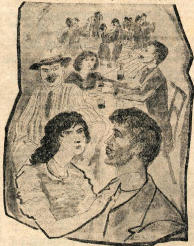
Vlado Lamet: GOSTILNA (1956)