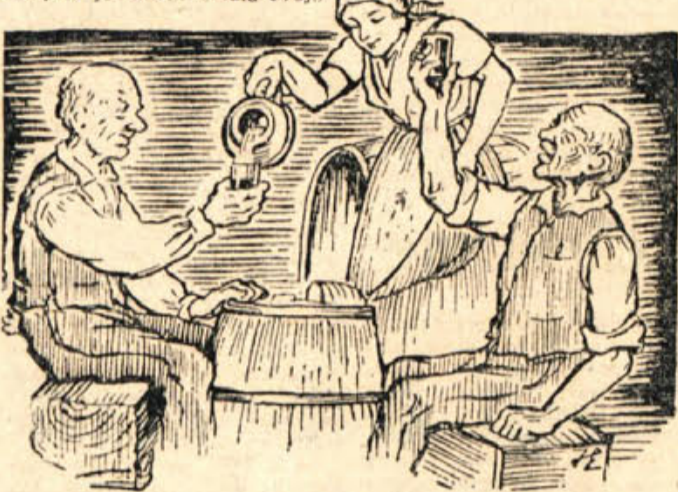
Takole je rekel in zvrnil kozarec črnina.

»Tri sto strelj Katra, jezik potegni za zobe, če te nič ne vprašam!« je Boštjan udaril po mizi, da so kozarci znova poskočili. »Zares sem jih rešil! Če ne verjameš, pa vprašaj kapitana na barki!«