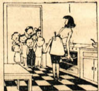
»Ali vaš sin laže ali pa res delate najboljšo potico v mestu — prišli smo se prepricati...«

Za 500 din bo prejel konec leta 1957 vsak član Prerševne družbe zopet 7 dragocenih knjig!