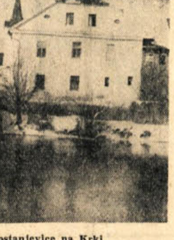
Zimski pozdrav iz Kostanjevce na Krki

Za redno članarino 320 din prejmete zbirko 5 knjig, za 500 din pa celo 7 knjig. Pohitite z vpisnino v članstvo Prerševne družbe