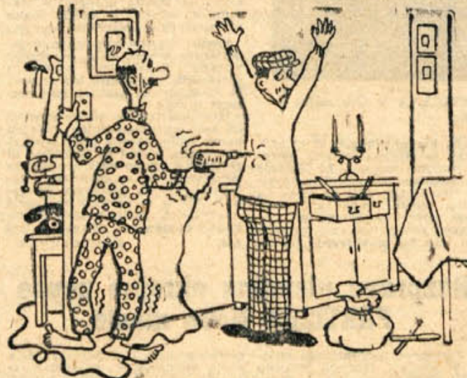
»Samo premakni se, pa te prevrtam kot desko!«

Takega »dvojca« v naših dolenjskih gozdovih že dolgo ni bilo.