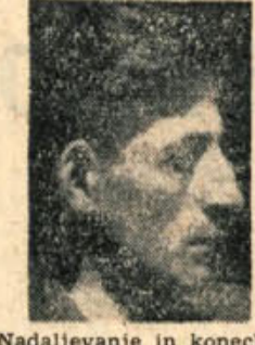
Nadaljevanje in konec)

Podržovalnim odbornikom društva je treba izreči za dosežane uspehe in nove delovne načrte vse priznanje! Naj vedo, da bi v Šmihelu ustanovili novo, samostojno društvo prijateljev mladine, saj ima zdaj že 850 članov. Od zadnjega občnega zbora je