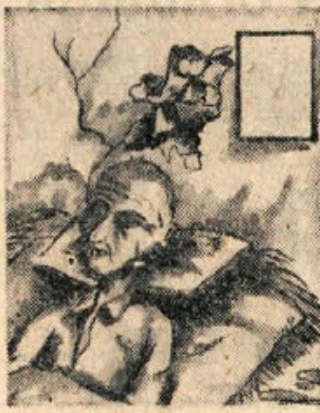
Sestradani interniranci v taborišču smrti na Rabu