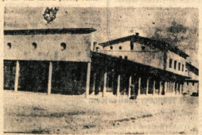
Prva na Dolenskem je bila po zadnji vojni zgrajena železniška postaja v Metliki

pred postajnim poslopjem tudi toliko razširiti, da tovrni avtomobili, ki stoje zaradi nakladanja ali razkladanja pravokotno do skladišča, ne bi zapirali ostalega prometa, ki je na tem mestu precej velik.