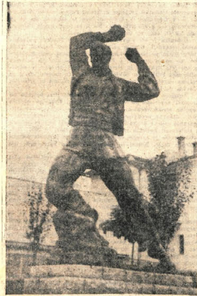
Partizanski spomenik v Metliki, ki bo slavila v ponedeljek občinski praznik — spomin na eno največjih in najpomembnejših bmag narodnoosvobodilne vojske v Beli krajini in na Dolenjskem — na likvidacijo belogardistov na Suhorju

Urejuje uredniški odbor. — Odgovorni urednik Tone Gošnik. Naslov uredništva in uprave: Novo mesto, Cesta komandanta Staneta 25. Pošt. predst.: Novo mesto 33. Telefon uredništva in uprave: št. 127. Rokopisov ne vračamo. Tiska Casopisno-izdajniško podjetje »Slov. poročevalec« v Ljubljani. Za tisk odgovarja F. Plevel