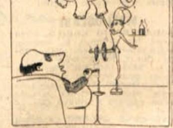
Cirkuski direktor: »Je to vse, ali znate še kaj?«

»Naš direktor napačno dela, ker se noče zmeriti ljudem. Jaz bi mu to najraje povedal, vendar se mu nočem zameriti.«