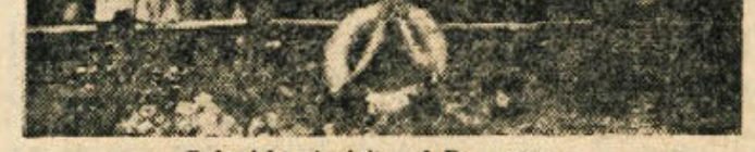
Dolenjski pionirji pod Poi znom (Berite članek na 4. strani)

zimi v kleti. Njene bele sočne liste uporabljamo za solato kot endivijo. Za vse mestne prebivalce, ki vrtno nimajo, pa morajo to zelenjavo preskrbeti zelenjadne trgovine in vrtnarje. Ziviljenje zahteva danes od človeka večjih naporov in sposobnosti kot nekdanj. Znanost odkriva tudi v prehrani nova pota za ohranitev zdravja in