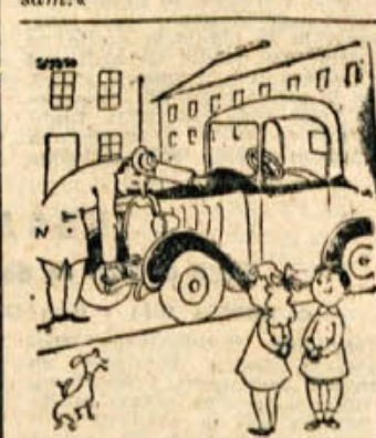
Nisem vedela, da so imeli včasih v avtomobilih gramofona namesto radia!

»Obtoženi, zakaj ste pa prinesli na sodišče tako debela gorjačo?« »Saj ste mi tako svetovali! V pozivu je bilo napisano, da naj si obrambo poskrbim same!«