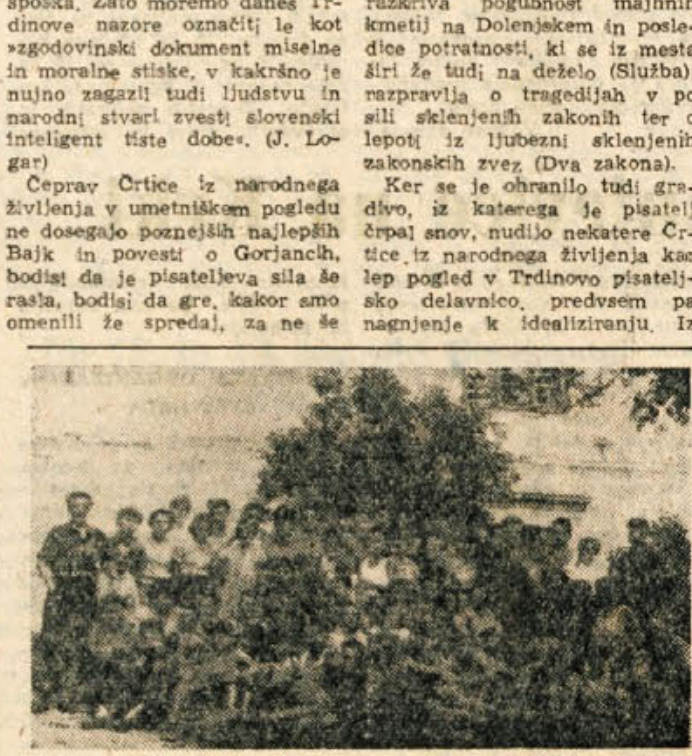
Srečanje otrok padlih borcev v Poljanah nad Skofjo Loko

Prav tisti čas, ko je pisatelj zbiral podatke o Dolenskih in skušal pod vplivom angleškega kulturnega zgodovinarja Buckia na podlagi študija pokrajine, socialnega, gospodarskega in političnega življenja proučiti v bistvo dolenskega človeka, je slovenski narod preživljal hude krize. Po sprejetju dualistične ustave 1867 se je avstrijski priključil na področje Slovence še pečeval, v gospodarsko zaostali Sloveniji pa se je pod vplivom kernal nastaločega domobnega kapitala življenje preprostejšega človeka, zlasti kmeti, že poslabšalo. Kakor nazorno prikazuje urednik v opombah, je od vseh naših pokrajinskih živila v najhujših pogojih Dolenski. Tu je bilo že pred revolucijo izkoriščanje največje, po zemljiški odvezi (1849—53)