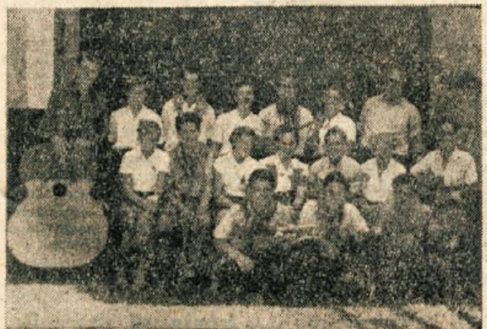
Tamburaška in folklorna skupina iz Otočca ob Krki

Nedavnemu posvetu občinskega sveta za prosveto in kulturo s predstavniki občinskega odbora SZDL in občinskega sveta Svoboda in prosvetnih društev je prejšnji teden sledila seja občinskega ljudskega sveta Svoboda in prosvetnih društev, na kateri so se pomenili zlasti o letošnjih občnih zborih društev, ki bodo do konca oktobra. Ko so razpravljali o načrtu dela posameznih društev, so člani sveta poudarili zlasti načelo, da mora biti pri vsem ljudsko-prosvetnem ustvarjanju vodilna kakovost dela in njegova prava vsebina, ne pa število iger, nastopov, prireditev itd. Člani prosvetnih društev naj bi poslej skrbeli zlasti tudi za pravilne, kulturne in socialistične odnose med ljudmi, kar naj izžareva že samo društevno delo, pa tudi od-