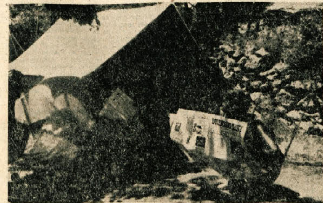
Počitnice je konec in samo lepi spomini na prijetne dneve, preživete pod šotori, v počitniških domovih, kolonijah, na planinah in drugje bodo ostali. Pa zdavje, ki se ga je letos naučila mladina ob morju in na Gorenjskem, ob Savinji in drugod po naših lepih krajih.