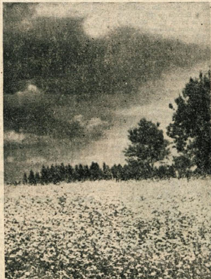
Ko ajda cveti, gre pri nas jesen v deželo. Letos, tako pravijo kmetje vzdolž Krke, po Mirenski dolini in drugod po Dolenjskem, ajdovih žgancev pozimi ne bo manjkalo...