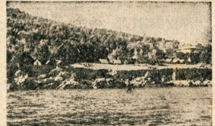
... medtem ko je bilo ostalih 48 dolenskih valencev 17 dni na morju v prijaznem taboru v Medveji, ki ga vidite na sliki