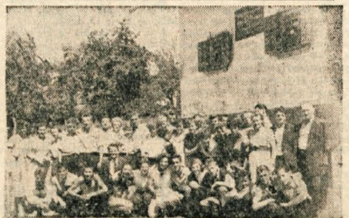
Dolenski vojenci, ki so preživeli počitnice v koloniji Društva prijateljev mladine v Poljanski dolini, pred Prešernovo rojstno hišo na Vrbi...

6. Potrebno odkazovanje gozdnega drevja iz varstvenih ukrepov... lahko odkazujejo pristojni operativni organi... — Podobna čebodra, kakor smo ji imeli zadnjič pri »prenajanju