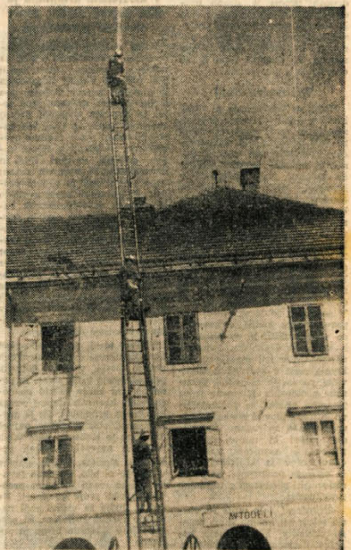
Naglo se približuje pomembna obletnica novomeškega Prostovoljnega gasilskega društva. To bo velik praznik za društvo, pa tudi za vso Dolenjsko, saj je bilo prav novomeško gasilsko društvo kot prvo na Dolenjskem matično društvo vsem kasneje ustanovljenim gasilskim društvom ter njih vodnik, učitelj in vzornik. Društvo je od vsega začetka skrbelo za vzgojo kadra. — Gornja slika nam nazorno kaže primer gašenja z 25 metrov visoke raztegljive »magirus« lestve. Sicer je model lestve še močno zastarel in bi društvo nujno potrebovalo modernije leste, vendar je zdaj še ne more nabaviti. Zato so vaje s staro zelo neokretno lestvijo še toliko potrebnejše.

Za zaključek »Mladinskega tedna«, ki je bil od 24. maja do 24. junija, priredila občinska komiteja LMS Straža-Toplice in Zuzemberka v nedeljo, 24. junija, veliko mladinsko zborovanje na Frati. Mladinci in mladinke obeh občin vabilo na to prireditve tudi mladino ostalih občin. Zborovanje se prične popoldne.