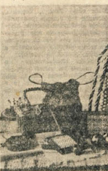
Adlešički izdelki domače obrti: pleterarski predmeti, tkiva, vezelne in pisnice

Tudi fantje naj bi prišli za delo kot pleterji. Dragotni, Vinica, Podzemelj in Metlika naj bi imeli svoje nasade, ki bi dajali dovolj vrbovega protja za pleterstvo in oskrbovali tudi druga pleterarska podjetja, kjer kbija prmanjkuje.