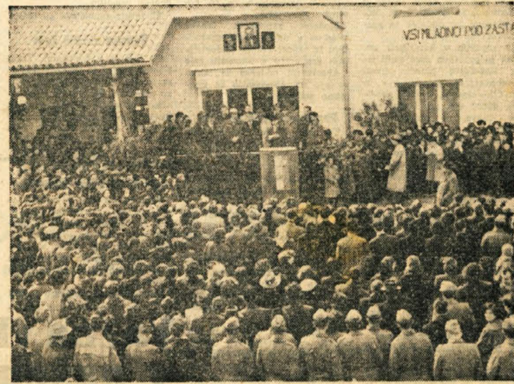
Z zborovanja brigadirjev in ostale mladine ob odkritju spominske plošče graditeljem železnike proge Otovac—Bubnarci v Črnomlju

V vseh dijaških domovih v novemškem okraju (Smihel pri Novem mestu, Smarjeta, Dolenjske Toplice, Trebnje, Črnomelj, Metlika) je 553 dijakov in dijakinj. Večina domov ne ustreza zdravstvenim niti vzgojnim predpisom. Učni uspehi so se od poletja sicer izboljšali, vendar so v veliki večini še vedno slabši od uspehov tistih dijakov, ki stanujejo izven internata ali pa se vozijo z vlakom.