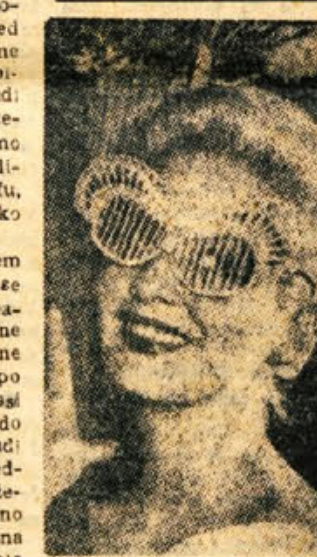
ZADNI KRİK MÖDE: sončna očala iz slame! Ognjeni pogledi so skriti za mrežo. Napovedano je zelo vroče poletje...