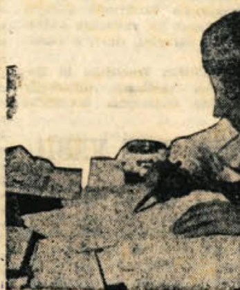
Pesnik Miran Jarc pri delu

za Jutro, Slovenca, Slovenski narod, za Naš rod in druge. Ze pred drugo svetovno vojno se je preselil v Ljubljano. Poprje se je moral voziti vsak dan v Ljubljano v službo. Navidez mirno je živel vse do razsula Jugoslavije. Potihoma pa je stitil vojni vihar tudi pri nas, skrbel je za narodna bodočnost. Leta 1941 je stopil v OF in deloval v trojki skupaj s Prežihom Vorancem in