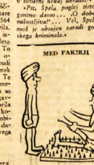
»Hoj! se, da imam trn v petli!«

ISTI METER — DVOJNA MERA »Poglej, Tona, le poglej tole babo: njen mož je zaprt, ker je v tovarni nekaj ukradel!« »Psi, Spela, poglej tistole elegantno damo... O dober dan, mladoljiva!... Več, Spela, njen mož je obsojen zaradi gospodarstvske kriminala.«