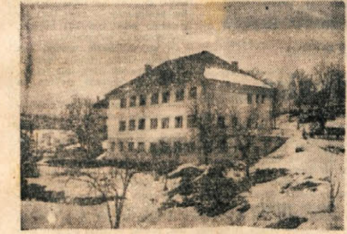
Dijski internat v Metliki

Eno leto že posluje zdravstveni dom v Metliki, pod vodstvom upravnega odbora s samostojnim finanšnjem. Kljub prizadevanju upravnika dr. Pečarja in upravnega odbora za izboljšanje zdravstvene službe v občini Metlika in ustanova vsakovrstne težave. Področje zdravstvene doma v Metliki obsega metliško občino z Gradacem, celotni Zumberak, del Vivodine in del občine Ribnik. Dnevno obsega ambulanto povprečno 40 do 50 bolnikov. Poleg tega pa še obisk na domu področja in ponoči. Zdravstveni dom v Metliki ima dve srednje veliki sobi. V eni je splošna ambulanta, v drugi pa pisarna in rentgenski aparat. Poleg tega je v isti sobi vsak petek redna posvetovalnica za matere, ki je ena najbolj obiskanih v Beli krajini. Obljub-