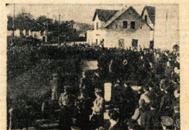
Oficirji in predstavniki ljudske oblasti nosijo krsto na lafeto pred Dom ljudske prosvete

Črnomeljski pionirji so zapeli še »Prečuden cvet...«, častna salva pa je okelela nad prezgodnjim grobovi, v katerem počiva v svobodni ljubeči zemlji srce nepozabnega prijatelja, tovariša in komuniste