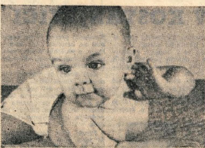
»Kaj skrbi in jeza, dokler sem pri mamici, mi ničesar ne manjka...«

Marsikdaj bi bilo seveda laže, če bi ne utrjalo staršev in otrok čakanje. Nikjer pa ne opazimo, da bi matere količkaj spretno zamotile otroke v čakalnicah. Niti nimajo a sabo igrice, niti malice, niti se ne spomnijo takrat povesti, ki bi otroku krajšale čas in jim odvrmile misli od vstopa v ordinacijo. Če bi i starši i zdravniki poskušali otroku pomagati preko težavnih ur, ki jih prestajajo okrog zdravniških pregledov, bi marsikdaj bilo mnogo laže najti pot do ozdravitve.