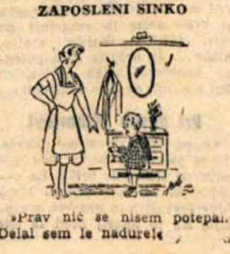
»Prav nič se nisem potepal. Delal sem le nadurele...«

Cenen šartelj: Potrebujemo: 15 dkg masla, 12 dkg sladkorja, 2 jajci, 2 omešniki do 3 omešnike 1 mlička, 50 dkg moke, 1 zavitek pecilnega in 1 zavitek vanilnega sladkorja, nekaj limone, 5 dkg rozin. — Naredimo rusko testo, ki ga damo v namačen model in v srednje vroči pečici spečemo. (Šartelj po tem receptu ostane dalj časa svež.) Orehov zavitek: 6 dkg masla, 10 dkg sladkorja, 1 jajce, 1/4 mlička, 50 dkg moke, 1/2 zav. pecilnega, 1 vanilni prašek, 10 dkg mletih orehov, naribane limonine lupinice, žlico medu, 1 žlica marmelade. — Med moko zmešamo s pecilnim praškom nadrobno maslo, vdelamo sladkor, jajce in mličko. Testo razvaljamo 1 cm debelo. Za nadjev zmešamo orehe, limonino lupinico, med, marmelado in vanilni sladkor ter namažemo testo. Zavitek domačemo z mličkom ali beljakom. Svetlorumeno zapecemo. 10 dkg masla, 10 dkg sladkorja, 1 jajce, 1/4 mlička, 50 dkg omešnih kosmičev, 10 dkg moke, 1/2 zavitka pecilnega in 1 zavitek vanilnega sladkorja. — Ovsneno kremeže prenesimo v model in dodamo vse ostale. Testo razvaljamo in oblikujemo šartelj. Kremo svetlorumeno zmešamo. Obklatena s slad. kremo. Jedemo tolimo in osušimo. — Sladkorni led: 100 dkg sladkorne moke, 200 dkg 5 minut s 3 jedilnimi žlicami malinove,