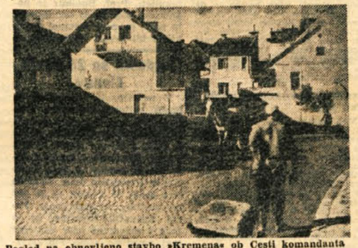
Pogled na obnovljeno stavbo »Kremenca« ob Cesti komandanta Staneta v Novem mestu

vajo dolžnosti in pravice zborov volivcev. Ni dovolj, da vedo samo to, da se nekaj dela oz. da se bo delalo; potrebno je poznati tudi sredstva, ki bodo za taka dela potrebna. Predračunska vsota pa jim je treba vsaj v glavnem povedati pred začetkom takih del. Čimprej svete potrošnikov! Zaradi pomanjkanja skladišč v mestu se vpliv državnih in združenih trgovskih podjetij zvezi s cenami kmečkih pridelkov vse premalo pozna. Trgovaška podjetja niso sposobna vskladiščiti večjih količin pridelkov, zato so volivci pozdravili zamisel o gradnji skladišč. Na III. trenju so volivci poudarili, da je treba čimprej imenovati potrošniške svete v trgovinah in povečati družbeno kontrolo nad poslovanjem trgovin. Premalo je tudi obrtniških uslužnostnih obratov, zato so prebivalci mesta in vasi prepriščeni na milost in nemilost raznim obrtnikom, čakajo na izvršitev del tudi po več tednov in mesecih, cene pa so neprimerne visoke. Naglo narašča tudi šušmarstvo, nad katerim je premalo nadzorstva. Mestna pekarne je preobremenjena in najmanjša okvara obrata lahko povzroči, da bo mesto dalj časa brez kruha. Nujno je treba urediti še eno pekarno in zboljšati prodajo kruha, ki ga zdaj dostikrat zmanjka, posebno ob nekaterih kritičnih urah. Volivci so razpravljali tudi o pomanjkljivi razsvetljavi v nekaterih predelih mesta, o nadaljevanju najnujnejših komunalnih del pri kanalizaciji, vodovodu, dograditvi športnega igrišča, o tržnici in pod.