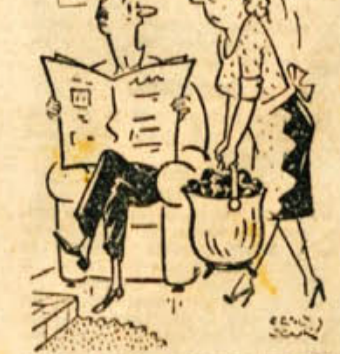
»Draga ženka, kaj stokaš, da teško nosiš! Naloži manj, pa pojdi dvakrat...«