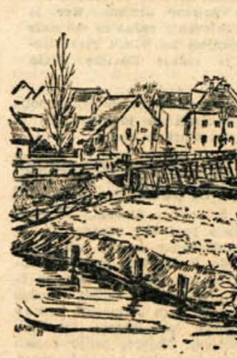
Vlado Lamut: KOSTANJEVICA NA KRKI — pogled iz gimnazije (tuš, 1955)

listu in radia je med našim prebivalstvom naletela na prav lep odmev in marsikdo na vasi je šele sedaj spoznal, kako važen je zanj domači časnik.