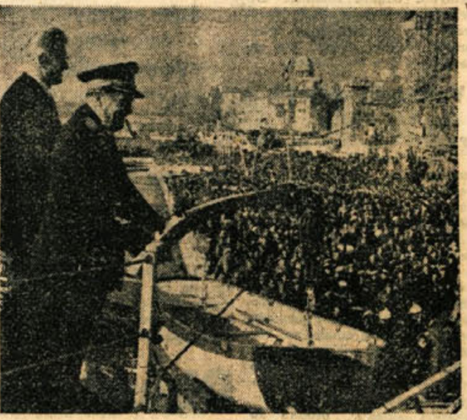
2. decembra je odpotoval predsednik republike Josip Broz Tito na državni obisk v Etiopijo (Abesinijo) in Egipt. Z uradnim spremljevalcem se je ukrcal v Abesinjskem pristanišču na ladjo »Galeb«, ki je spremljala žez Sredozemsko morje, Suezki prekop in Rdeče morje rušilca »Blotkov« in »Durmort«. Maršal Tito bo s tem vrnil lanski obisk cesarja Haile Selassija v Jugoslaviji in obiskal na povratku tudi prijateljski Egipt. Obisk našega predsednika bo še bolj pogluben in razširil dosedanje jugoslovansko-etiopsko in jugoslovansko-egipčevsko sodelovanje in prijateljstvo ter znova dokazal naše stalno ustvarjalno mednarodno sodelovanje za okrepitev miru na svetu.