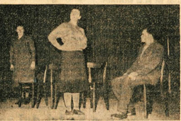
Prizor iz prvega dejanja