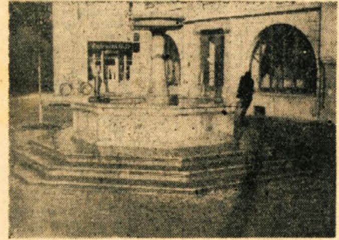
Spominski vodnjak na novomeškem Glavnem trgu

ga počez. Nastale so dvokrake — vislice! Za koga bodo? — Kmalu smo izvedeli. Zbognali in nagnali so na trg mnogo ljudi. Na oba kraka teh grozotnih vislic so obesili po enega človeka. Dva partizana. V pouk »ofarjako« nastrojenim Novomeščanom in v strah prebivalstvu so pustili vs- tri oba obelena do 16. ure. Lju- dje so se vislice izogibali v veli- kem loku. 31. decembra: Videlce na Glav- nem trgu se vedno stroje, po za- porih pa ječijo ljudje, ki so jih obdolžili delovanja in simpatij za OF in partizane. Eden najhujših zaporov za slovenske ljudi je Be- dovi v kletj; na Ločenski cesti. Bi- dovi obrazi žalostno pogledujejo skozi mazo, zamreženo lino na železnih vratih. Pred kletjo je stalna domobranska straža. Proti ponoči se je pričelo stre- lianje po mestu ki je obojnost doseglo vlek. Meščani so bili prepričani, da so partizani na- padli mesto in da so že pobužni boji. Vse je bilo razburjeno. O ponoči pa se je oglasila na cestah in ulicah divja nemika in ruska pesem in haemionika. Prišlo se pokat rakete, da je bilo svetlo kot podnevi. Tedaj šele smo opa- zili in soznali, da vojaštvo raz- žuje Števestrovo. Okupator je zavljal sedni dan leta ... Poldek Ogilj