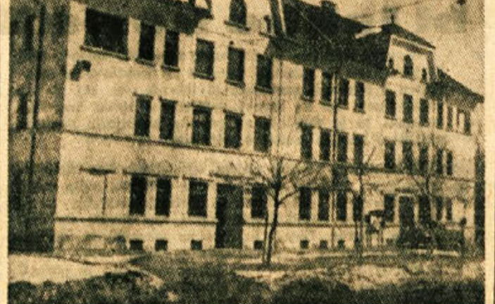
Stavba občinskega ljudskega odbora v Trebnjem, ki s prostori ni v zadrugi

V času, ko mora biti motorno vozilo osvetljeno, sme voznik dati je svetlobne znake za opozarjanje. V naseljenih krajih mora voznik motornega vozila dati zvočna znamenja za opozarjanje povsem kratko. Za spremembo smeri vožnje voznik motornega vozila ne sme dati zvočnih znamenj.