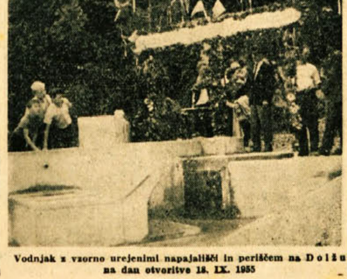
Vodnjak z vzorno urejenimi napajališči in periščem na Dolžu na dan otvoritve 18. IX. 1955

Po fekmah bo tradicionalna veselica s trgatvijo grozja, kulturnim sporedom in pod. Sodeluje Radio Ljubljana. Iz Ljubljane bo vozil na Turistični dan poseben vlak, o čemer boste obvestila v dnevnem tisku.