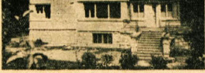
Zdravstveni dom v Črnomlju

Poškodovanih oseb, kiso iska- le zdravniško pomoč, je bilo na 100 prebivalcev v novomeškem okraju 1,59, v kočevskem 2,87, v krškem 1,97 in v črnomal- skem 1,72. Procent zajema samo zavarovance in ne šteje tudi ostalih. Zato je število v res- nici precej večje. Gotovo je, da izvira dosti nesreč zaradi ne- znanja in malomarnosti, še več so krive alkoholne pijače, pre- celj pa tudi neupoštevanje hi- giensko-tehničnih predpisov in drugih varnostnih navodil za delo. Nekaj nesreč gre še m