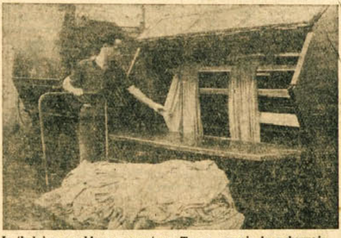
Iz tkalnice gre blago v apreturo. Tu ga operejo in pobarvajo. Najrazličnejše barve in vzorec naših oblik, s katerimi se radi ponašamo, naredite tu.

»No, samo da bomo oblečeni za zimo. Kaže, da sva dobro kupila. Tudi drugi pohvalijo. Veliko ljudj, veliko ve. Pa zakaj bi tudi kar tako hvalili, če ni bilo sramo, saj gredo lahko čez cesto kupiti.«