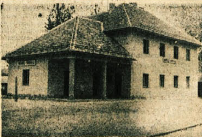
MIRNA ima novo železniško postajo. V delu je tudi postaja v Mirni peč, le Trebuže še čaka...

Ta cvet, ki mu res ni para, se imenuje Arnolds in cvete v vzdovih Sumatre (Indonezija). Ko cvete, požene orjaški cvet škriatne barve. Cvet ima 1 meter premiera, težak je pa 7 kilogramov.