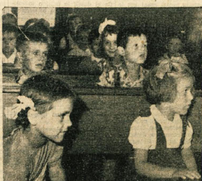
Se nekaj dni in spet se bodo odprla vrata šol. Velik dogodek bo to, zlasti za najmlajše, ki bodo prvič stopili čez šolski prag, hkrati pa takorekoč tudi na svojo življenjsko pot, ki jih bo od prvega poznavanja pisane in tiskane besede popeljala v izo- brazbo, v svet znanja in omike. Njim, tem našim najmlajšim, želimo lepe, vesele in rodovitne ure za šolsko klopjo. Naj pridno zajemajo prvo učenost, v veselje staršem in vzgojiteljem, sebi pa v korist in ponos, da bodo neko č kot zreli ljudje delavni, izo- braženi in napredni člani nove družbe in svoje socialistične do- movine