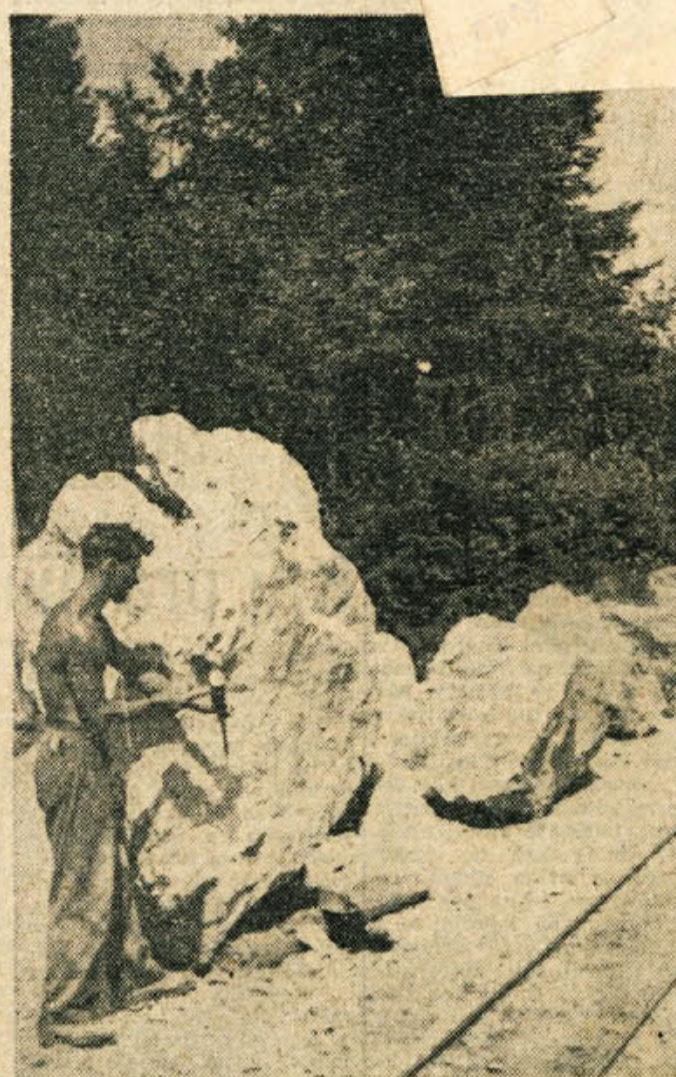
ZAKLADI BELOKRANJSKE ZEMLJE: grašaški kamnar obdeluje skoraj 10 ton težko skalo marmorja

Zanimiva je namenska poraba potrošniških kreditov. V primerjavi z letom 1953 je šlo lani za nakup tekstila 40 odstotkov manj posojil. Za r-tup radio aparatov se je poraba kreditov dvignila na 125 odstotkov, za nakup koles na 800 odstotkov, za nakup opreme pa na 110 odstotkov.