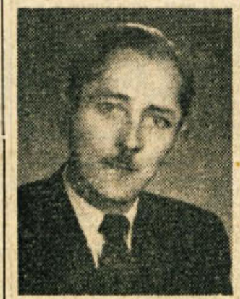
znani po svojem napredno kremenem in poštemen značaju.

boriti za vsaj skromni življenjski občutek. Ze kot mlad fant se je moral zaposliti s težkim gozdničkim delom. Nato je odšel služiti svoj vojaški rok, potem pa ga je zadela doba brezposelnosti. Na lasni koži je bradko občinski knjižnični sodnik red stare Jugoslavije in sprevidel, da v taki družbeni ureditvi delavski razred ne more živeti človeka dostojno življenje.