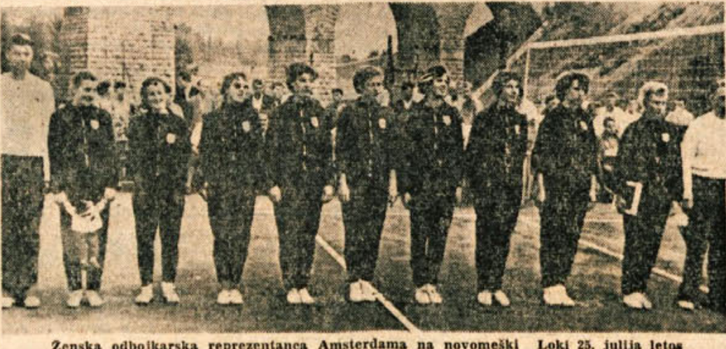
Zenska odbojgarska reprezentanca Amsterdama na novomeški Loki 25. Julija letos

Prišel v vas, vpraša cigana, zakaj mu ni vsaj povedal, da je tam v bližini medvedka z mladiči. Pa je menil cigan: »A da, da sem jaz kaj rekel, bi naju lahko oba požrla!«