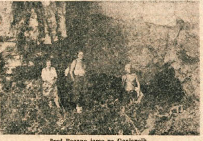
Pred Pogano jamo na Gorjancih

Kmalu nad Cankarjevo kočjo gremo spet mimo vhoda v kraško jamo. Ponovno se vrstijo zavoji brez konca in kraja, dokler ne dosežemo mesto, kjer je nekdo stala gornja postaja žič-