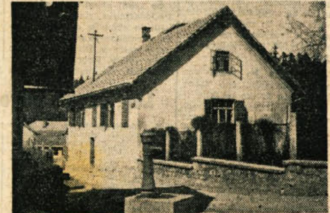
Trdinova hiša v Vrhovčevi ulici v Novem mestu, v kateri je pisatelj tudi umrl

B. K. Trdinove nagrade V neposredni zvezi s Trdinovo knjižnico so Trdinove nagrade, osnovane 1954 v počastitev velikega slovenskega pisatelja, ki je pretečni del svojega življenja posvetil produkciji Dolenskih. Nagrade podeljuje vsako leto na dan Trdinove smrti (14. julija) okrajni odbor Ljudske prosvete. Nagrada je namenjena kulturnoprosvednim delavcem za pozitivno znanstveno, umetniškega in ljudskoprosvednega dela na Dolenjskem. Razdeljena je na pet enakih delov in se podeli za literarno, likovno, pedagoško, znanstveno in ljudskoprosvedno delo. Pravico, da predložijo delo za nagrado, imajo vsi kulturnoprosvedni delavci Dolenskih, ne glede na vsebino ali motu njihovega dela, kulturnoprosvedni delavci izven Dolenskih pa lahko predložijo le dela, ki obravnavajo Dolensko ali imajo dolenske motive. Prve nagrade so bile podeljene lani, letos, 14. julija pa so bile podeljene drugič.