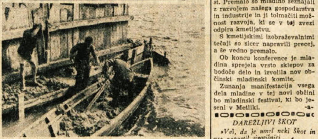
Takole so ukrotili naraslo Kolpo gojenci inženirske podoficirske šole JLA, ko so v 24 dneh postavili novi most pri Zuničih

dramskih sekcijah, tamburaških zborih itd.; vedno več mladine se vključuje v športna društva in klube; mladina se sestaja na debatih veberih in razpravlja o aktualnih političnih, gospodarskih in kulturnih vprašanjih. Se sedaj se mladinci posvečujejo in pripravljajo načrte za izobraževanje tečaje v prihodnji zimski sezoni, na katere bodo prilegli tudi ostale člane SZDL. Po svojem delu in uspehih sta sedaj najpogostje mladinska aktivna v Gradcu in na Radovici. Poleg lepih uspehov je konferenca ugotovila tudi napake in pomanjkljivosti. Mladina bodoče metliške občine je pretežno kmečkega porekla in pri marsikom je še čutili zaostalost vasi. Premalo so mladinci seznanjali z razvojem našega gospodarstva in industrije in ji tolmačili možnost razvoja, ki se v tej zvezi odpira kmetijstvu. S kmetijskimi izobraževalnimi tečajji so sicer napravili precej, a še vedno premalo. Ob koncu konference je mladina sprejela vrsto sklepov za bodoče delo in izvolila novo občinski mladinski komite. Zunanja manifestacija vsega dela mladine v tej novi občini bo mladinski festival, ki bo jeseni v Metliki.