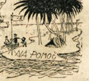
— Tako, končno vas imamot! Cemu niste prijavili prejemkov za leto 1954-55?!