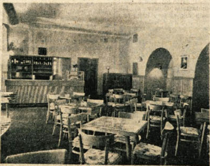
Sodobno urejeni gostinski lokali privabljajo turiste in so dokaz našega napredka. Pogled v okusno opremljeno kavarno hotela »Metropol« v Novem mestu

Nič manj privlačna ni Bela krajina s svojimi brezovnimi gajmi in vinorodnimi predeli. Zelo zanimiva je Kočevska, ki ima mnogo prirodnih lepot. Polna je vseh vrst rastlinja, kraških jam, strmin in skalovitih pobočij in