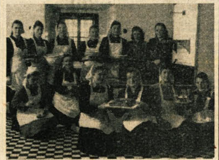
Tečajnice iz Male Loke so postale pridne gospodinjice, na nedeljskem festivalu pa so potrdile, da tudi rade in lepo zapojejo.