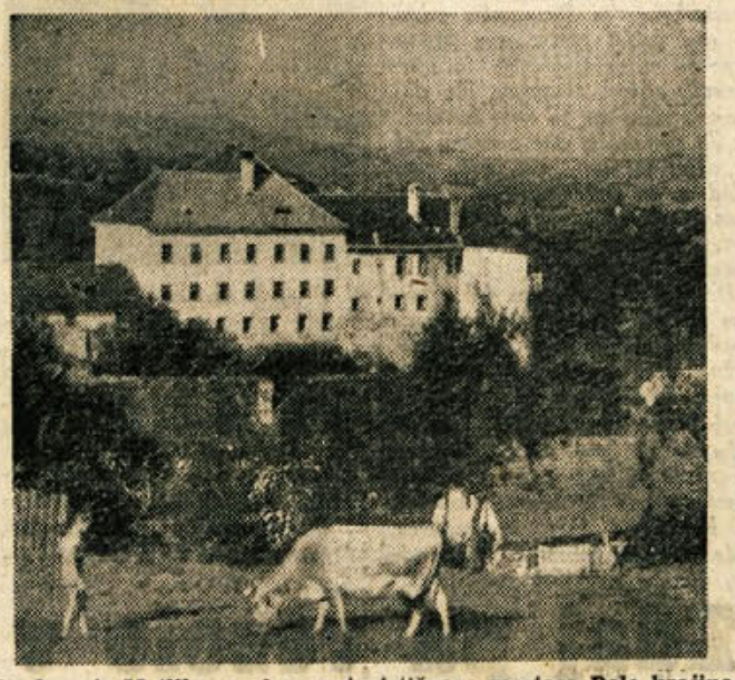
Pozdrav iz Metlike, prelepega turističnega mesteca Bele krajine

Kot v državi, republikli in okraju, tako je tudi v občini socialistično gospodarstvo tisto, ki vpliva na narodni dohodek prebivalstva in predstavlja glavno gospodarsko osnovo družbenega upravljanja, hkrati pa usmerja celotni družbeni napredek. Prav ta socialistična gospodarska dejavnost pa je v občini še zelo šibka. Čeprav ima ročna obrt na tem sektorju svojo tradicijo, od sedaj ustanovljena socialistična obrtna podjetja le še niso pokazala pravih uspehov. Čevljarstva produktivna zadruga v Metliki je v času planske proizvodnje zaposlovala 37 delavcev, sedaj jih je zaposlenih