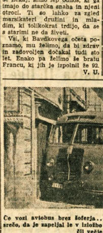
Ce voz avtobus brez šoferja... V Novem mestu je imel to srečo, da je zapeljal le v izlozbo britanskega lokala in ni povzročil večje škode.

Tapetništvo in dekoraterstvo NOVO MESTO Iskruje KVALITETNO IN PO NIZKIH CENAH tapetiranje vseh vrst foteljev, divanov in klučev, izdeluje prvovrstne zgornje in spodnje žimnice, namerčane in izdeluje okenske sončne in večerne zaves.