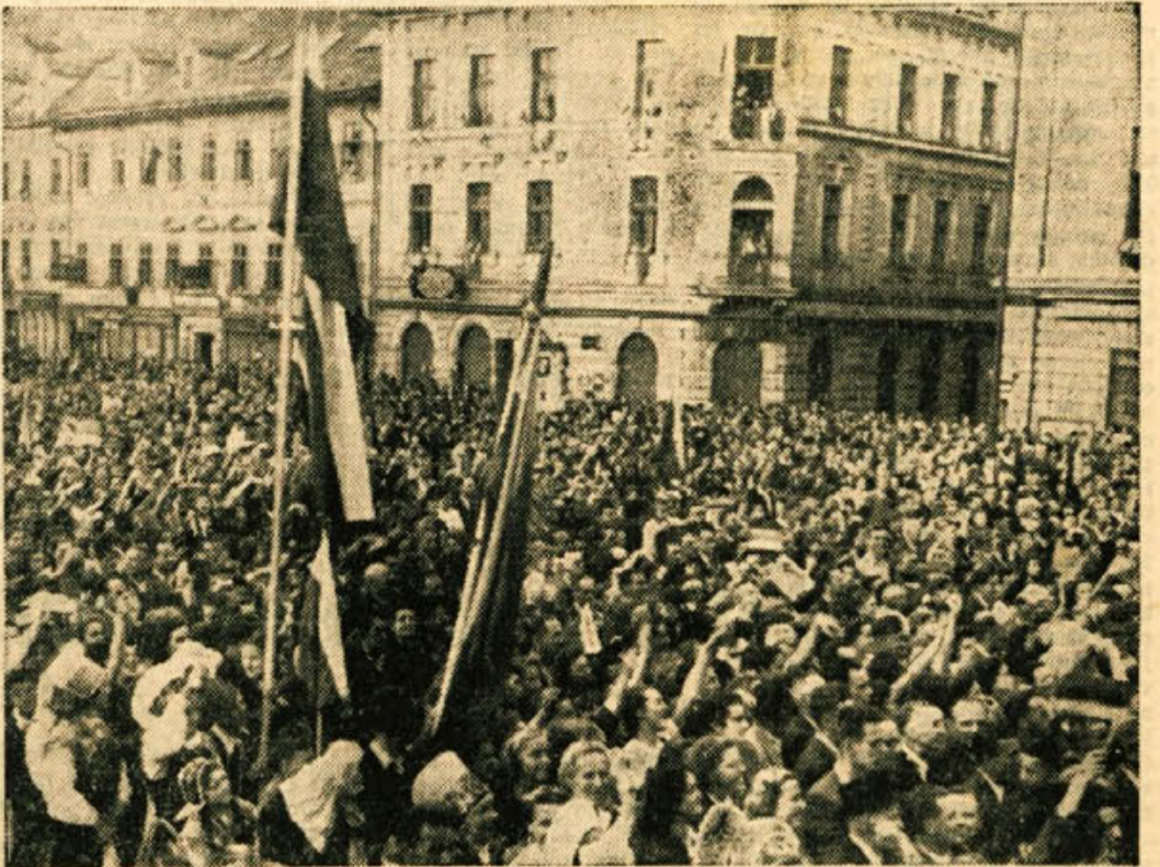
Ta pesem velikega časa revolucije in borbe je v velikih majskih dneh 1945 zmagovito zaorila po slovenski domovini in razglasila uresničeni cilj vseljudske vstaje: »Slovenija junaška, svobodna zdaj si ti!« Osvojen je okupatorjev, izdajalcev, izkoriščevalcev, mrakobe stoletij! Pelj so je borci, pel jo je ves narod, še osvobojena zemlja jo je odpevala. »Brigade s hribov so se vsule kakor plaz« — 1. maja osvobojeno SLOVENSKO PRIMORJE, 4. maja je prišel Glavni štab Slovenije v osvobojeno AJDOVŠČINO, 5. maja je v Ajdovščini Boris Kidrič sestavil prvi NARODNO VLADO SLOVENIJE... 8. maja osvobojeno NOVO MESTO... 10. maja je prišla v Ljubljano Slovenska narodna vlada. S Triglava je nad prelepo in novo slovensko domovino zavihrala naša nova zastava s peterokrako — simbolom borbe, svobode, socializma.

„Slovenija junaška, svobodna zdaj si ti...“