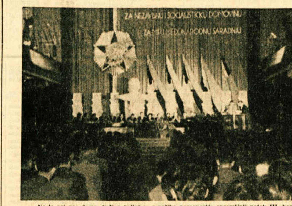
Ne je pri nas doma, tudi v tujini so z veliko pozornostjo spremljali potek III. kongresa Zveze borcev. Nekateri tuji napredno usmerjeni časniki so ta kongres imenovali »Zborovanje miru«.