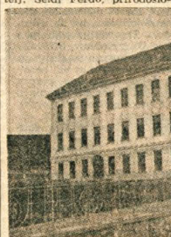
Poslopje novomeške gimnazije ob otvoritvi leta 1912