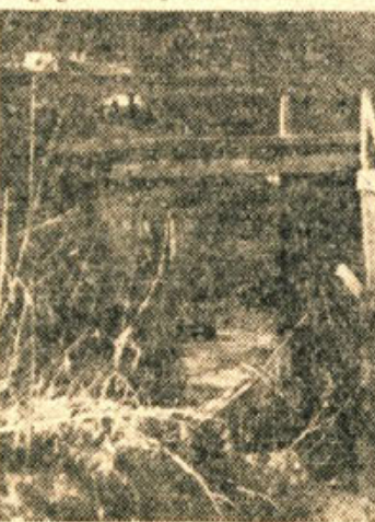
Leseni mostovi — resna prometna ovira na Dolenskem (most čez Temenico pri Prečini)

Ljudem ni bilo težko objasniti, kaj pomenijo kislila zemljišča in kakšne so neugodne posledice kislin v zemlji. Saj so se sami že nestrastno, prepričani, da v črni publicah in v stelnjskih njivah kos kovanega železa (podkve, motike in pod.) razpada v obliki listov. Tako so ga razgrizale kisline, ki so neprimerno močnejše od navadnega rje. Na slikah so tudi videli, kako take publice pobelijo črna apnenčeva kamen in ga na površju spremenijo v mehko belo kredo. Povsod so zatrjevali, da je za njihove njive cestno blato izredno dobro sredstvo za izboljšanje. Cestno blato pa ni skoro nič drugega kakor od koles strti