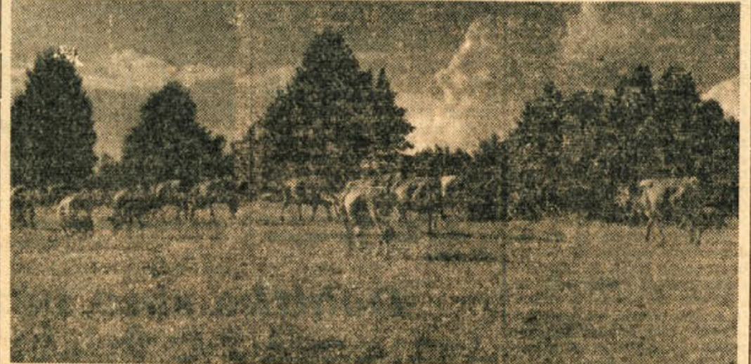
Pašniki na gospodarskem posestvu Livold na Kočevskem

ske bike iz reje že v starosti od 4 do 5 let. Največkrat navajajo kot glavni razlog za izločitev preveliko težo. Če bi biki plemenili dalj časa, vsaj do starosti 7 do 8 let ali še več, bi s tem mogoče zmanjšali potrebo po denarnih sredstvih za nakup bikov. Se važnejše pa je, da bi s tem dobili od dobrih bikov, kakršne je težko dobiti, več naraščaja. Prav iz teh razlogov držijo n. pr. ameriški živinorejci plemenske bike celo do 17 leta starosti. Da bi se tudi pri nas vsaj delno počešal oba držanja plemenskih bikov je v že omenjenem razpisu zagotovljena vsakemu Če bo eden ali več kmečkih proizvajalcev skupaj posadilo sadna drevesca tako, da bo nasad velik vsaj 20 arov, se bo izplačal iz razpisanih sredstev prispevek v višini nabavne vrednosti sadnih drevesc. V poljedelstvu je poleg krmnih rastlin najvažnejša kultura krompirja. Krompirja sadijo naši kmečki proizvajalci nad 20% njivskih površin in je zato zelo važen za doseg dohodkov. Da bi izboljšali živinorejo in tako vplivali na večji pridelok je v omenjenem razpisu predviden tudi prispevek za pozitivno odbero krompirja. Pozitivna odбира krompirja pomeni, da