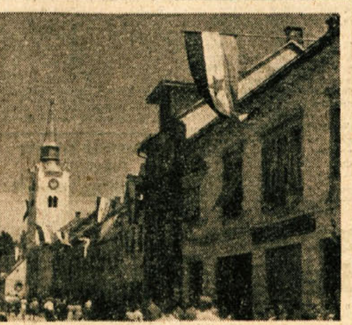
CRNOMELJ V slavnostnih dneh (glej članek na str. 2). Slika je z lanskih proslav

novno pa nihče ni poskrbel. KZ naj bi takoj ukrenila vse, da se uredi drevesnica, ki bi te kraje zalagala s sadikami. Krompir prinaša lepe dohodke, zato naj mu kmetskovalci posvetijo vso skrb, saj tenajo dober zgleđ pri svoji KZ. V bližnji prihodnosti se obeta ustanovitev zdravstvene postaje, ki je več kot potrebna.