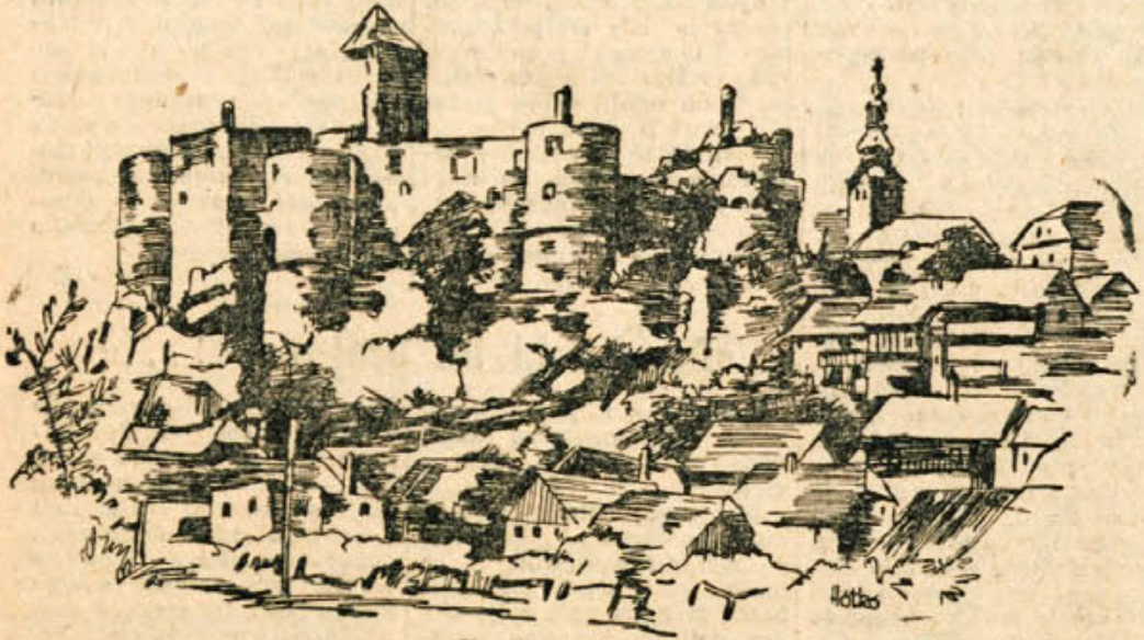
Pogled na Žužemberk