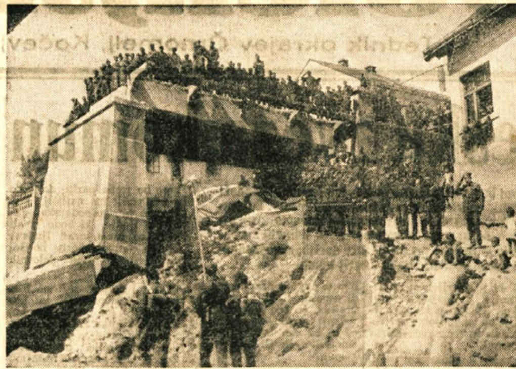
Veličasten sprejem primorskih brigad v Črnomlju marca 1945

Tako kot ne bosta vloga in doprinos Bele krajine kot celote v času NOB nikdar dovolj podčrtana, tako je težko opisati v celoti vlogo vloga in doprinos samega Črnomlja v tem najbolj zgodovinskem obdobju. Upor proti okupatorju je v mestu vzniknil takoj ob njegovem prihodu. Ta upor je kmalu dobil konkretne oblike z zbiranjem orožja, prvimi akcijami ter odhodom prvih Črnomaljev v partizane, katerim so se takoj pridružili tudi Metličani in drugi. Okupatorjev teror, ki je dobil še posebno ostro obliko ob sodelovanju tistih sicer redkih domačih izdajalcev in bednih ostankov v Črnomlju že prej osvojenega klerikalizma, ni zlomil Črnomaljev. Vezni s partizani v zgodovini in narodno osvobodilnim gi-