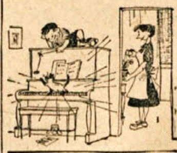
»Tako, Tonček, za danes si dosti vadil, zdaj se greš lahko igrati!«

»Ja, ja, kaj takega pa še ne. Saj smo bile tudi me vroče, ko smo bile mlade, toda tako, da bi kar gorele, pa vendar ne.«