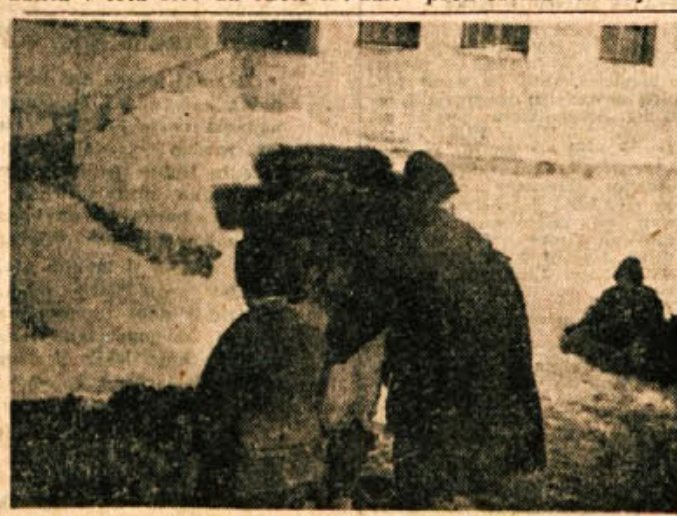
Pred desetimi leti so tuji in domači okupatorji divjali v zadnjem obupnem sovraštvu. Januarja 1945 je na tisoče beguncev iz Drežnice na Hrvaškem, ki so bežali pred ustaši v Zumberak, našlo začasno zavetje in bratsko pomoč v Črnomlju. Na sliki: stara mati z otroki, od katerih je eden v zadnjem bipu ušel ustaškemu klavcu in nosi na vratu še sledove noža.

Ljudska skupščina Slovenije je pretekli teden po daljši razpravi sprejela družbeni plan in proračun za leto 1955. Družbeni plan predvideva povečanje družbenega produkta v letu 1955 za okoli 15