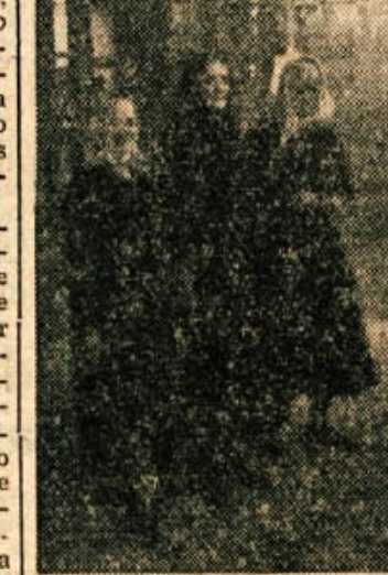
Tri belokranjske mamice grede v osvobodjeni Beli krajini prvič in na prve svobodne volitve (aprila 1944)

Letos 14. in 15. januarja je minilo 10 let, od kar so se zbrale v Črnomlju na pokrajinsko konferenco antifašistke Slovenije. V slabem vremenu in velikem snegu so prišle žene iz Notranjske, Kočevske, Dolenjske, celo žene iz Primorske. Veliko je bilo žena iz Bele krajine. Kulturnoprosvetna dvorana v Črnomlju je bila polna. Zenam-delegatkam konferenca je spregovoril to-