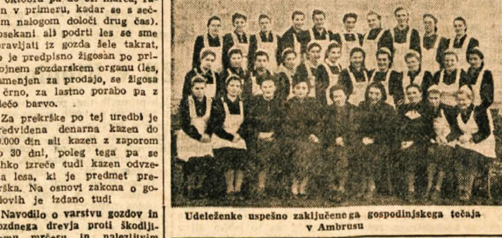
Udeleženci uspešno zaključena gospodinjstva tečaja v Ambrustu