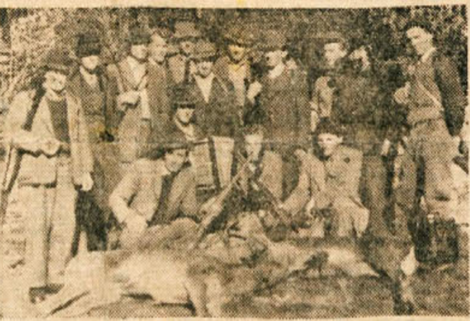
Lovska družina Loški potok ima precej sreče. Na enem zadnjih pogonov so lovci uplenili dve košuli.

Občinski odbor Protiletalske zaščite na Vinici je organiziral tečaj PLZ. Tečaj obiskuje 32 tečajnikov, za učno snov pa imajo predavanja iz sanitetne, požarnostne, tehnične ter kemične službe. Tečaj je vsak terek in petek od 18. do 20. ure v prostorih šole. Ob koncu tečaja, v marcu, bodo tečajniki opravili izpite.