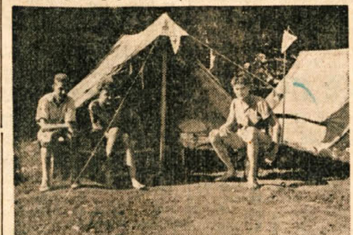
Taborniki v svojem taborišču

Pojutrišnjem se bodo sestali v Ljubljani predstavniki vseh slovenskih enot in opazovalci iz drugih republik na 4. redno letno skupščino Zdrženja tabornikov Slovenije. Pregledati