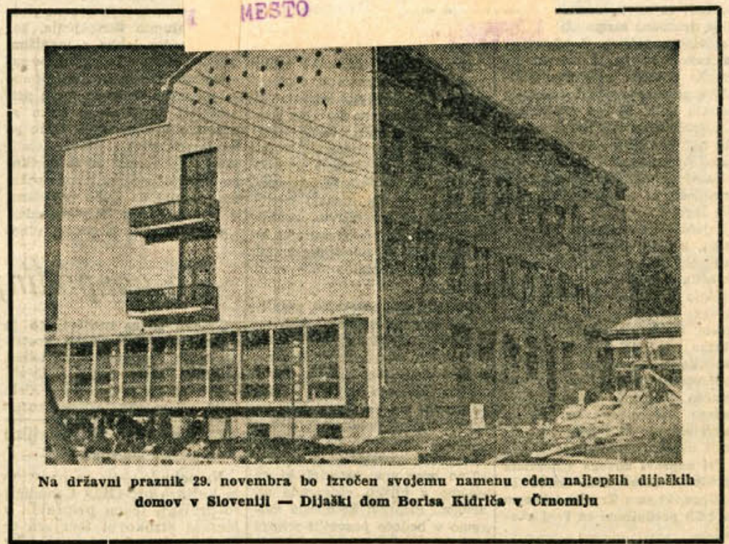
Na državni praznik 29. novembra bo izročen svojemu imenu eden najlepših dijaških domov v Sloveniji — Dijaški dom Borisa Kidriča v Črnomlju

za čas od 29. do 28. nov. Do konca tega tedna suho, lepo vreme. V jasnih nočeh mraz. V prihodnem tednu nestalno s padavinami. Sneg do nižin, zlasti okrog 27. novembra.