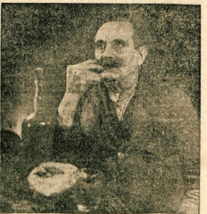
Letočni vinski pridelek sicer ni najboljši, je pa kar dober, kot priča zadovoljni obraz stare korenine, ko poskuša trikogorca

Janez Rupnik—Može Pesem od slabe ure v okolici Trške gore, ki je trpel leta 1873 zavoljo toče