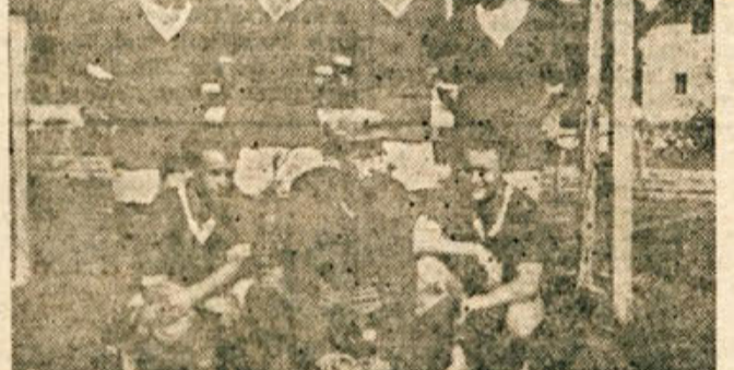
Rokometna ekipa Partizana iz Črnomelja, ki vodi v II. slovenski ligi v malem rokometu.

na zelenem polju obračunala — kdo je boljši? Trejo skupino sestavljajo Polje Ljubljana, Svoboda Kmetije in Partizan Novo mesto. To so tri izenačena mošt-