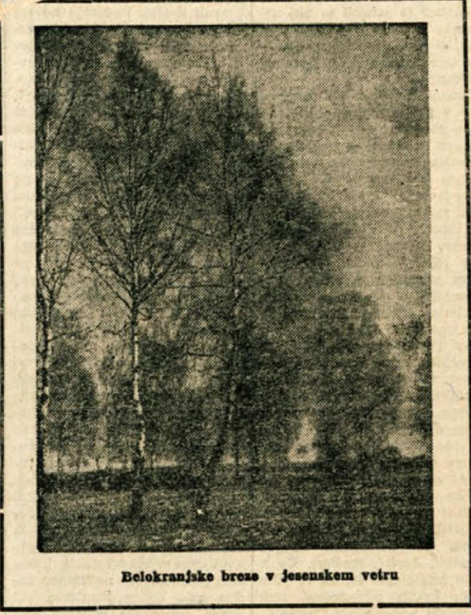
Belokranjske brze v jesenskem vetru

Zbor proizvajalcev je prav na tem zasedanju skupno s strokovnjaki veliko razpravljal o prepotrebni gradnji proge. Zbor je izvolil petčlansko komisijo, ki bo skupno z merodajnimi skušala najti sredstva za zgraditev proge vzhajajo do Kanizarice. Z ozirom na več kot utemeljeno gospodarsko nujnost te proge in ker so vsi načrti in projekti gotovi ter veliko zemeljskih del že opravljenih, računa komisija Bele krajine na popolno razumevanje in podporo vseh merodajnih.