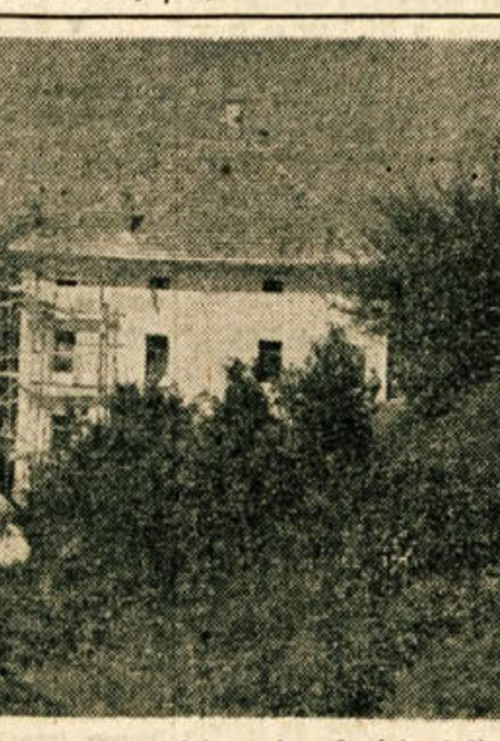
V Kotu pri Mirni bo do konca leta urejen okrajni mladinski dom, v katerem bo prostora za 45 otrok, ki so najbolj potrebni družbene vzgoje. Nekaj jih je že sprejel.

V četrtek 4. novembra je bil v Novem mestu posvet sekretarjev občinskih komitejev in osnovnih organizacij ZKS, katerega so se udeležili tudi člani okrajnega komiteja ZKS. Na posvetu so obravnavali politično delo organizacij ZK in posameznih članov, slabosti, napake in uspehe tega dela ter še nekatere organizacijska vprašanja.