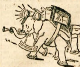
Indijski maharadža je moderniziral svoje slone

»Tvoj pes je tulil tso noč.« »To je znak smrti. Radoveden semjdo bo umrl.« »Tvoj pes, če bo nocej spet tulil!« Jaka je lovil z ženo muhe po sobi. »Koliko si jih dobil, ga je upražil čez čas.« »Sest — tri samce in tri samice.« Neumnost, kako moreš to vedeti? »Prav lahko draga«, ji je razložil, »tri so bile na sladkorju, tri na na ogledalu!«