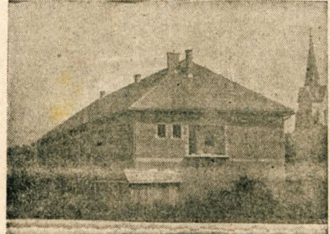
Nova šola v Sentrupertu (Poročilo na 2. strani)

bitelji lepe domače pesmi, a so jih tudi to pot Dvorjani in okolici »dali v kožo, kajti domačin so prav počasi polnili dvorano. Ceprav okoli ni bilo ravno primerno za koncert, so se pevec potrudili in navdušili poslušalce.