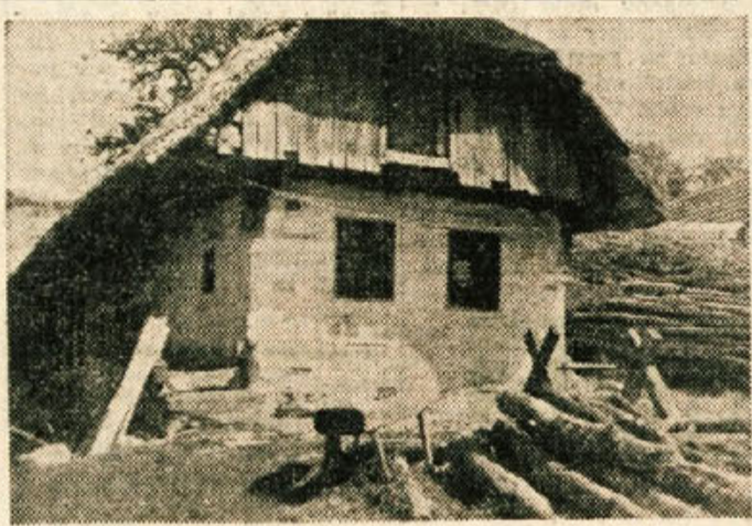
Belokranjska hiša — ena mnogih značilnosti prelepe Bele krajine

Vlak odpelje. Lovčev ravnotežje delajo uslužbenci dalje.