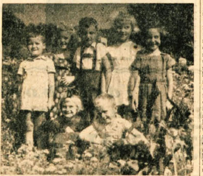
»Lepo je v naši domovini biti mlad...«