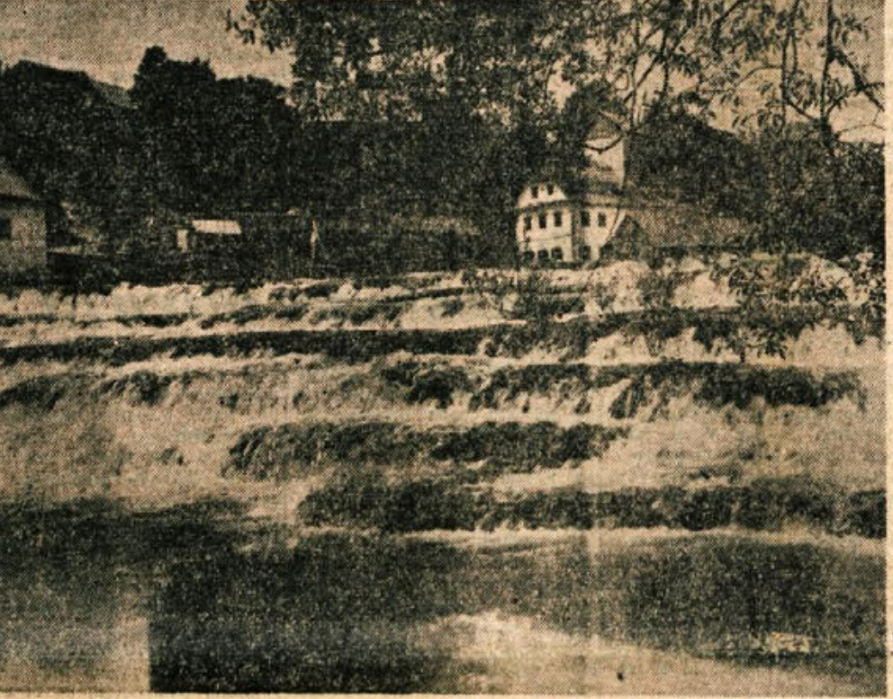
Poezija Suhe krajine — naravni slapovi Krke pri Dvoru

Ze ta bežni prelet Suhe krajine avgusta letos priča, da tu di pasivni predel dohitava druge kraje in da v novi državi ni zapostavljen in pozabljen. Ko bo Suha krajina, ta svojevrstna deželica ob gornjem toku Krke, imela poleg šol, zadrudnih domov in vode še elektriko po vseh vaseh, bo tudi zanjo nastalo novo in lepše življenje.