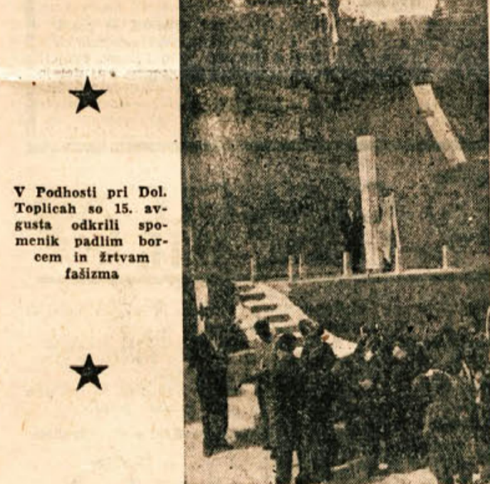
V Podhosti pri Dol. Toplicah so 15. avgusta odkrili spomenik padlim borcem in žrtvam fašizma