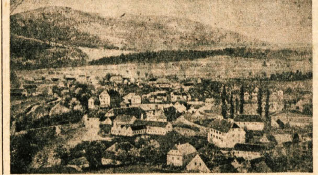
Dvor pred sto leti

Mnoge živali rade uživajo narkotična in omamna sredstva prav tako kot ljudje. Znano je, da se opice opijejo do nezavesti in da z največjim užikom pokade odvrženo cigareto. Tudi kamele so strastni kadilci. To njihovo slabost Arabci dobro poznajo in tudi izkoriščajo, kadar je treba pripraviti k poslušnosti to trdoglavo žival. S cigarami spravljajo v dobro voljo svoje grbaste živali. Na gobec jim pritrdirjo trioglato deščico z luknjico v sredini, v katero vtaknejo prižgano cigareto. Deščica je nameščena tako, da žival lahko vdiha dim. Pohlepno ga uživa. Dim izdihava skozi nozdrvi in pri tem mežika od blaženosti. Sreča pa je kratkotrajna, ker kamela hudo vleče in zato cigara hitro dogori.