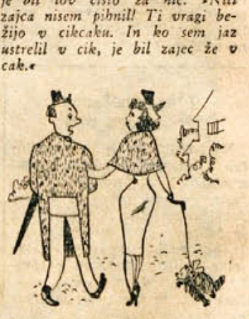
»Draga moja, le kako ti je uspelo dobiti tako hitro tako blago kot je moje?«

LOVSKA SMOLA Lovec Korenček toži ženi, da je bil lov čisto za nič. »Niti zajca nisem pihnil! Ti uragi bežijo v cikaku. In ko sem jaz ustrelil v cik, je bil zajec že v cak.«