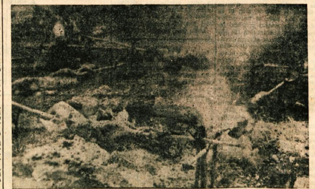
Na ražnju pečeni janči so znana belokranjska posebnost. Ob 22. juliju si jih je v Zlebu in drugod po Beli krajini maršidko privoščil.

»Belokranjka« je prvo strojno pletilsko podjetje Bele krajine. Razstavljalo je razne pletenine in zavesa za okna. V tem paviljonu so razstavljali tudi: »Planina«, čevljarstvo podjetje iz Črnomlja dobro in ceneno obutev, šola na Vinici narodne vzorce, Siviljsko podjetje Metlika pa ženske oblike. Delo RKS od ustanovitve pa do danes je bilo prikazano zelo živo, zlasti za vojni čas. Šolska mladina je razstavljala ribe in ročna dela. Lovska razstava je pokazala življenje divjadi in delo belokranjskih lovcev po osvoboditvi. Videli smo različne živali in orožje, s katerimi jih lovijo. Tovarna učil je razstavljala laboratorijske in lekarniške tehtnice, projektorje lastne konstrukcije, avtomobilske smerne luči, stikala, učila in šolske klopi. Belokranjska železovlvarna izdeluje lite izdelke, ki jih je tudi pokazala: peči, mreže za cestne požarnike in kotle raznih velikosti. Gradaška industrija marmorja je prikazala obdelavo kamna. V rudniku Kanizarica je moral vsak obiskovalec »skoz« pravi rudarski rov. Spoznali smo se z razvojem rudnika in s kvaliteto premoga. V največjem paviljonu so razstavljali svoje izdelke mizarški podjetji iz Črnomlja in Semčice in obrtniki raznih strok. »Telekomunikacija Semčice in Ljudska tehnika sta pokazali lepe izdelke, toda mislim, da bi jih lahko še več.« T. M.