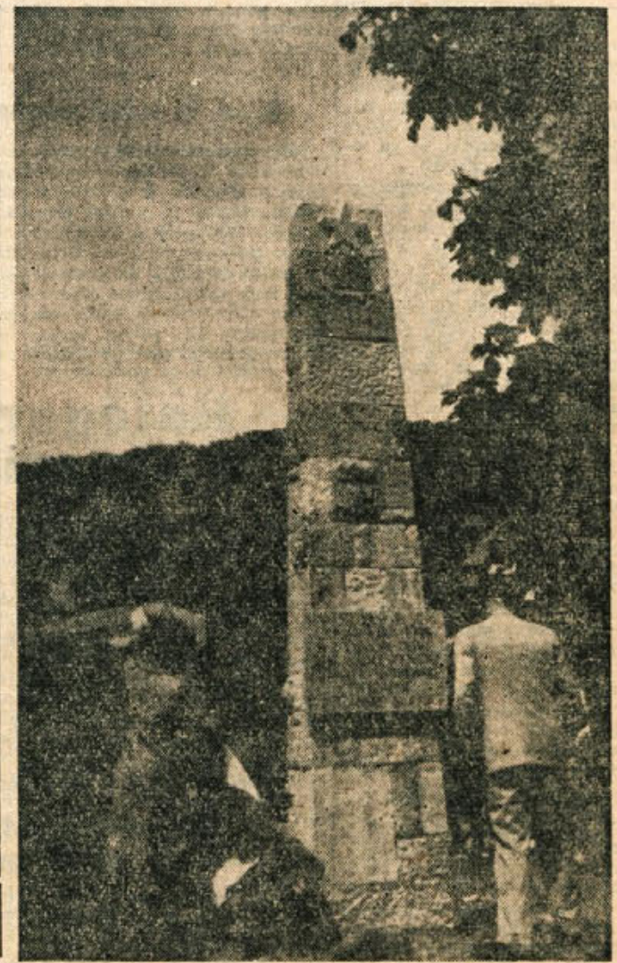
Spomenik partizanskim bolnišnicam, ki so ga 11. julija odkrili na Planini pri Semiču, je hkrati spomenik nastanku, razvoju in obsežnemu delovanju partizanske sanitete v letih NOB