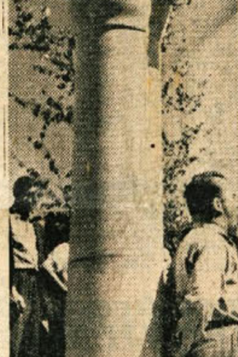
Na Suhorju so 21. julija odkrili spomenik v spomin na odhod XIV. divizije