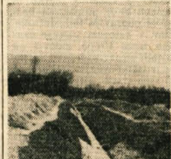
Glavni izsuševalni jarek v Kozarjih pri Sentjerneju poglabljajo

izdelavo načrtov za Zabrđščico 700 tisoč dinarjev je pripeloval republiški proračun, ostalo pa je dal okrajni ljudski odbor Novo mesto. Za nadaljnja izsuševalna ter ostala melioracijska dela, ki se nadaljujejo predvsem v Kozarjih pri Sentjerneju in Verjehišcih pri Mirni, so letos zaposlili za 8 in pol milijona din investicijskega kredita. Ko bodo kopčana obezna melioracijska dela okoli Sentjerneja, v nekaterih predelih ob Krki in Mirenski dolini, bo kmetijsko v novomeškem okraju pridobilo znatna zemljišča za večjo pridelavo poljskih pridelkov, predvsem pa živinske krme.