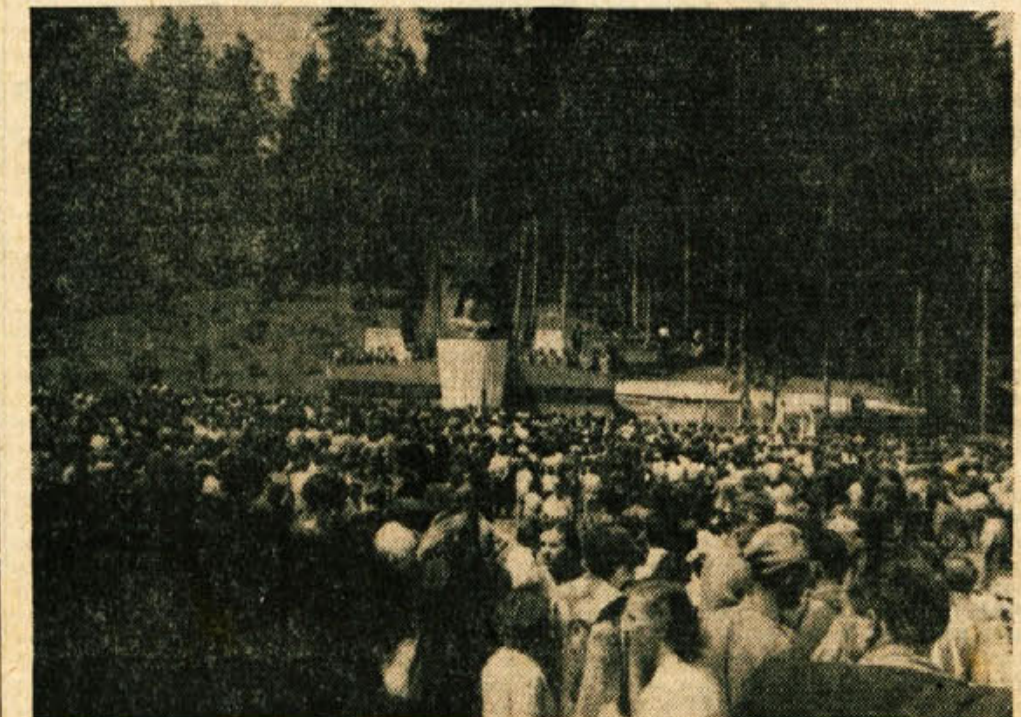
Del udeležencev pred tribuno na slavnostnem zborovanju v Zlebu

Z nekim uvoznim podjetjem v Istanbulu je tovarna avtomobilov v Pribuju na Limu sklenila pogodbo za dobavo okoli 100 avtomobilov letno v razdobju prihodnjih desetletij. Po tej pogodbi bodo letno dobavili Turčiji 125 kamionov po štiri do osem ton nosilnosti.