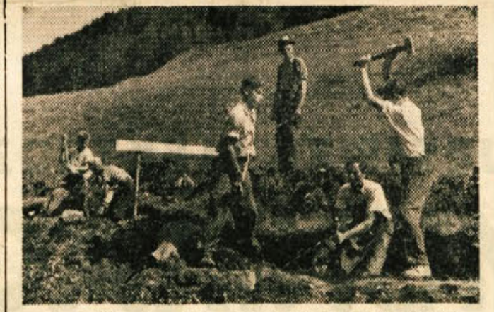
Nad 1000 metrov jarka za novi vodovod so že izkopali

Upravnemu odboru Vodne skupnosti se je posrečilo, da je zbral nekaj denarnih sredstev za začetek gradnje. Okraj Ljubljana-okolica je dal 8 milijonov din, iz sredstev za pomoč zaostlim krajem je bilo določeno 30 milijonov, znatna sredstva so v ta namen obljubila podjetja in kmetijske zadruge, pa tudi sami člani Vodne skupnosti so do sedaj obljubili prispevkov v skupni vrednosti nad 1.700.000 din. Posmenanja vredno je gasilsko društvo na Vrhu pri Dobrnjč, ki je prispevalo iz svoje blagajne 30.000 din. Upravni odbor, ki opravlja dela v glavnem v lastni režiji, ker je to najcenejše, je preskrbel že znatne količine cementa, betonskega