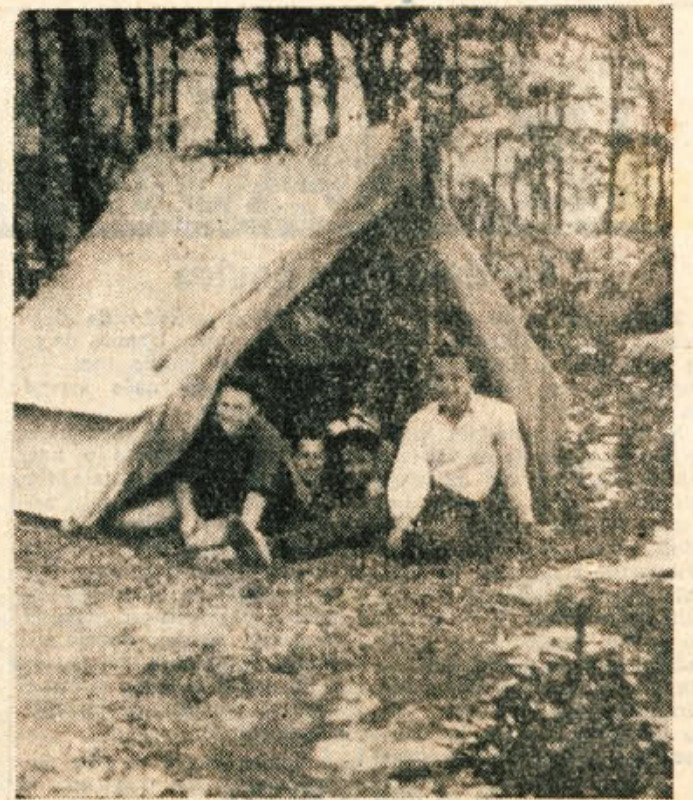
Letos se svetijo šolniki ob Kolpi, onkraj Vinice. V nedeljo so jih postavili dijaki in dijakinje novomeškega učiteljskega. Kmalu jim bodo sledili učitelji novomeškega okruga, od 16. julija do 2. avgusta pa bodo taborili ob Kolpi fantje in dekleta Rodu gorjanskih tabornikov iz Novega mesta.

V splošnem je igra potekala zelo zadovoljivo. Opaziti je bilo celo, da mladi igralci niti niso imeli izreke, še manj pa jih je brigalo, da je bila govorna samo do četrtine polna, kar je vsekakor za Novo mesto zelo porazno. Na predstavo ni bilo niti moštvo niti starišev vajencev, niti zastopnikov oblastnih forumov. —