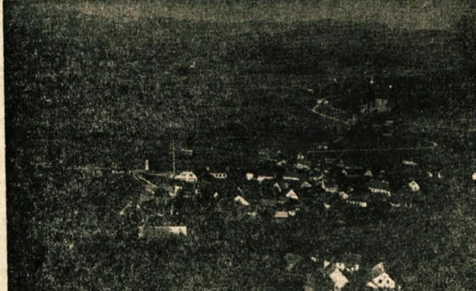
1. julija bodo tudi v Mokronogu praznovali občinski praznik. Več o tem znanem dolenjskem trgu berite v podlistku na drugi strani današnje številke

ZK in SZDL si od teh seminarjev mnogo obetata. Predvsem