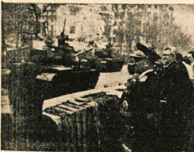
Motorizirane, pehotne, konjeniške in druge enote Jugoslovanske ljudske armade so 1. maja defilirale v Beogradu poleg tribune, na kateri je bil predsednik republike maršal Tito z drugimi državniki Jugoslavije in tujnimi vojaškimi in diplomatskimi zastopniki.

Znani nemški vojni zgodovinar Walter Görlitz je izdelal obširno delo v dveh zvezkih: »Druga svetovna vojna. Velik del te knjige je posvečen jugoslovanskemu partizanstvu in boju na Balkanu. Dasi ta zgodovinar zlasti glede osvobodilne borbe jugoslovanskih narodov mnogokrat potvarja resnico ter daje napačne sodbe in poglede, prinaša vendar v tem svojem delu tehtne, dokumentirane zaključke, ki pred svetovno javnostjo izpričujejo velikanski pomen in veličino naše partizanske borbe in njeno vlogo za propad nacizma in fašizma.