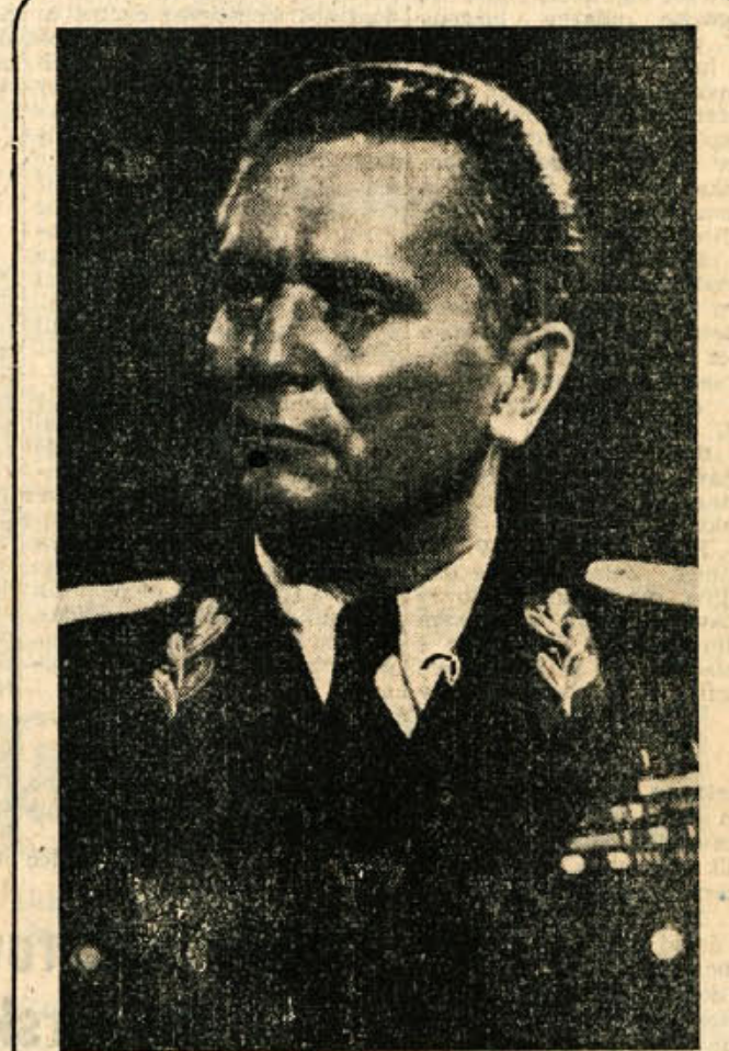
Tudi ob 62. rojstnem dnevu pošiljajo delovni ljudje Dolenjske, Kočevske in Bele krajine dragemu maršalu Titu svoje najpriskrbnejše čestitke in pozdrave: NA MNOGA LETA, DRAGI TOVARIŠ TITO, ZA SREČNO IN PROCVIT LJUBLJENE SOCIALISTIČNE DOMOVINE!