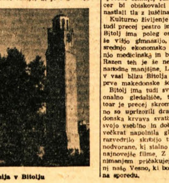
Saš kula in džamija v Bitolju

nim le burek, ki je tu prava narodna jed. Bureki so polnjeni s sirom ali z mesom in jih prodajo silno veliko na dan, zlasti v jutranjih urah, ko grebo ljudje na delo. Zjutraj tudi srečam v vsakem koraku prodajalce vrtnice rakije, ki jo segrevajo v posebnih, prenosnih pečicah. Posebnost so tudi prodajalci pečenih bučnih pečk — spedečne semkije, jim pravijo Makedonci, ki jih zelo radi jedo. V kinodvorani opozarjajo posebni napisi, da je prepovedano jesti pečene semkije, razumljivo, sicer bi obiskovalci na debelo nastajali tla z lučninami. Kulturno življenje v mestu je tudi precej pestro in razgibano. Bitolj ima poleg osnovnih šol še višjo gimnazijo, učiteljsko, srednjo ekonomsko šolo, srednjo medicinsko in babisško šolo. Razen teh je še nekaj šol za narodne manjšine. Letos je bila v vasi blizu Bitolja 100 letnica prve makedonske šole. Bitolj ima tudi svoje profesionalno gledališče, toda repertoar je precej skromen. Nedavno so uprizorili dramo »Makedonska krvava svatoba, ki je s svojo vsebino in dobro izvedbo večetkrat napolnila gledališče. Za razvedrilo skrbijo tudi tri kinodvorane, ki stalno predvajajo najnovejše filme. Z velikim zanimanjem pričakujejo Bitoljčani našo Vesno, ki bo v kratkem na sprejdu.