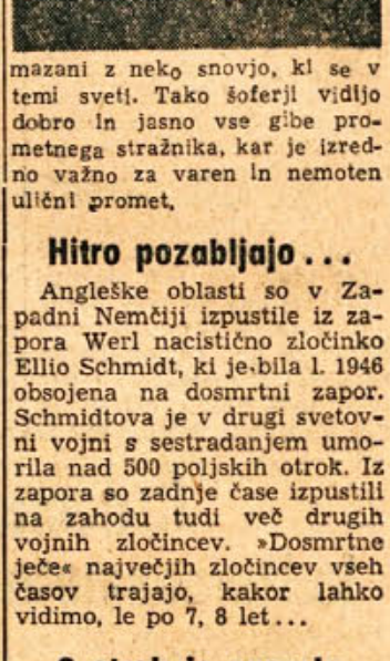
Svetleči stražniki Prometni stražniki v zapadno-nemškem mestu Brunswicku so dobili nove uniforme, na katerih so rokavi in kape pre-

v že obstoječih naselbinah ali v njihovi neposredni bližini. S tem bi bila izpolnjena velika vrzel v zgodovini Dolenjske. Vsekakor pa se bo pri gradnji nove avtoceste po Dolenjski odkrilo marsikaj zanimivega in dragocenega za našo najstarejšo in staro zgodovino. Stab za delo na cesti bo moral zelo vestno ravnati s takimi nahajališči in biti najtesneje povezan s predstavniki Zavoda za varstvo spomenikov. V. S.