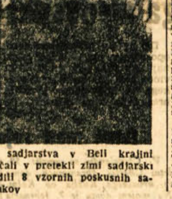
Za razvoj in sodobno urejanje sadjarstva v Beli krajini skrbje letos tečajniki, ki so dokončali v pretekli zimski sadjarski tečaj v Crnomlju. V okraju so uredili 8 vzornih poskusnih sadovnjakov

V nedeljo je bilo v Novem mestu consko dijaško prvenstvo v odbojki za Dolenjsko. Nastopili so dijaki in dijakinje iz Brečic ter učiteljica in gimnazijec Novo mesto. Iz Crnomlja so prišli samo dijaki, iz Kočevja in iz Krškega pa se niso pojavili. Tekmovanje se je pričelo ob osmi uri jutraj in je trajalo skoraj do 14. ure. Tekmovanje so prekinili za čas komemoracije ob