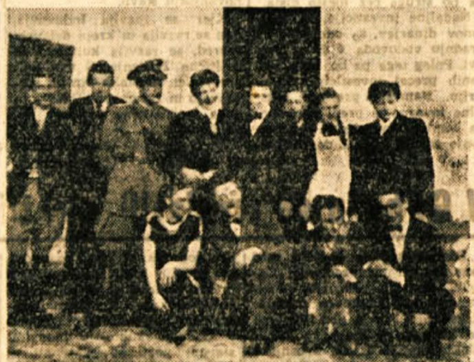
Igralska družina v Dobrnici ob uprizoritvi »Babilona«

Letos bo dobil Škocjan tudi prepotrebno zdravstveno ambulanto, za katero se občani že