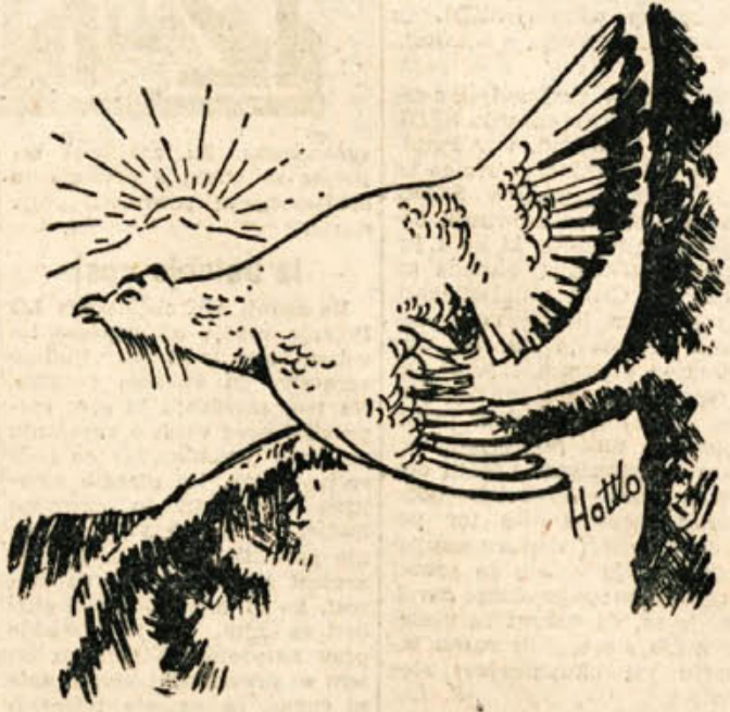
Zapel je divji petelin...