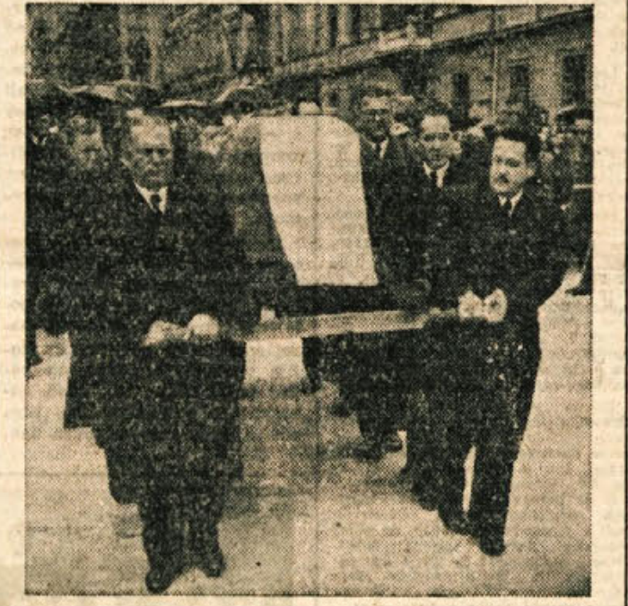
Lani 14. aprila so položili v grobnico herojev v Ljubljani posmrtno ostanke heroja Borisa Kidriča - Petra Kalana

Tovariš Kidrič pri svojem ogromnem delu v času borbe ni mogel imeti veliko časa za mladinsko organizacijo. Vendar si je v vsak mesec ali na pol drug mesec odrgal kakšno uro časa, da bi nam pomagal in porizvedel, kako delamo. Zlasti v kritičnih trenutkih nisimo nikdar pogręšili njegove pomoči.