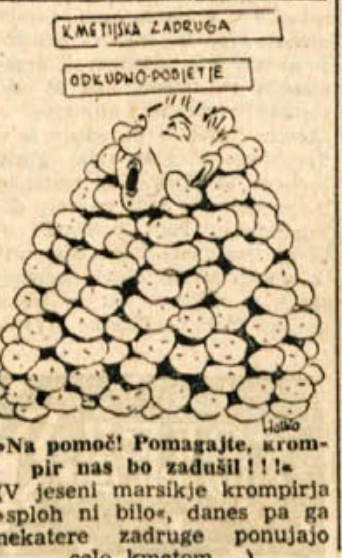
»Na pomoč Pomagajte, krompir nas bo zadušil!!« (V jeseni marsikje krompirja sploh ni bilo, danes pa ga nekatere zadruge ponujajo celo kmetom...)

Pogorela je zidanka na Lisicu, ko so po pobojnih nepremišljeno požigali suho tra-