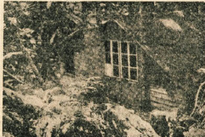
Barake v kočevskem Rogu, kjer je leta 1942 živel in delal tovariš Boris Kidrič

ki, ki so pokazali, da je tov. Kidrič, ki nas je poslušal, snoval in mislil daleč vnaprej. — Kmalu je bil ustanovljen iniciativni odbor Zveze slovenske mladine in maja 1943 je bil prvi sestanek na Pugledu. Julija je bil reorganiziran Pokrajinski komitej SKOJ — ki je bil do takrat raztresen po vsej Sloveniji in ni imel svojega središča, odkoder bi kolektivno vodil mladinsko gibanje. Odslej je imel svoj sedež v »bazi 26« na osvobojenem ozemlju. Se pred kapitulacijo Italije smo bili razposilani po vsej Sloveniji, da bi poneli množično gibanje mladine še v druge predele in tudi v vojsko. Ta pomoč je bila kasneje še izdatnejša.