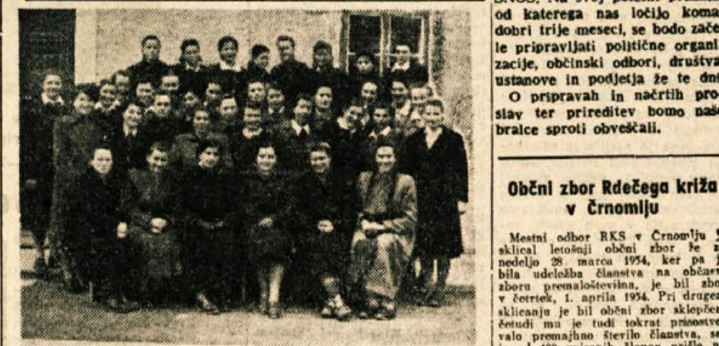
Letos je bilo precej uspešnih tečajev Rdečega križa za mladinke na podeželju. Na sliki: udeleženke II. tečaja Rdečega križa v Sentjerneju