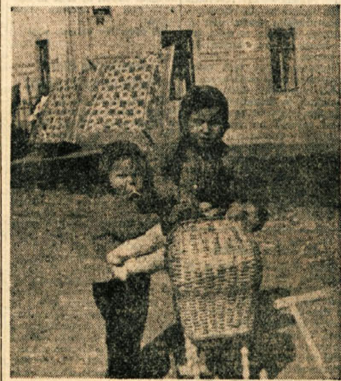
Tudi ta dva Novomeščana je z vabilo toplo sonce pred hišo...