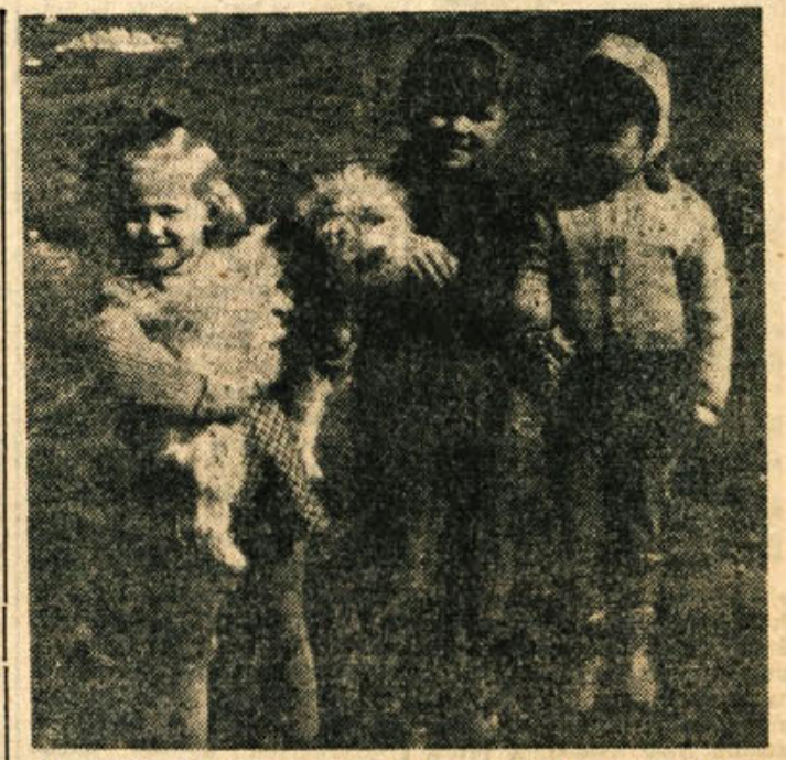
23. marca nas je po dolgi zimi prvikrat toplo in prijazno pozdravilo pomladansko sonce. Naši trije prijateljski so se z Bobjem vred korajžno postavili pred fotografa — le pogledite jih, kako zadovoljno se smejejo! Pomlad je tu, prelepa pomlad...

članku v Dolenjskem listu, je to trenutno ena izmed najvažnejših nalog vseh organizacij. Občinski odbori SZDL so dobili nove žige in potrebni šteto izkaznic, zato je treba pričeti z razdeljevanjem čimprej. Zelo dobro so se lotili priprav za razdeljevanje izkaznic v Škocjanu, kjer so na sestankih obravnavali dosedanje delo, pobrali članarino in denar za izkaznice. Tako imajo točen pregled članov in vedo, komu naj izdajo člansko izkaznico. Tako bi morali razvati tudi drugod. Samo razdeljevanje je bolj ali manj formalnost; najvažnejši je razgovor s člani in nečlani o dosedanjem delu organizacije, o njeni vlogi, iz-