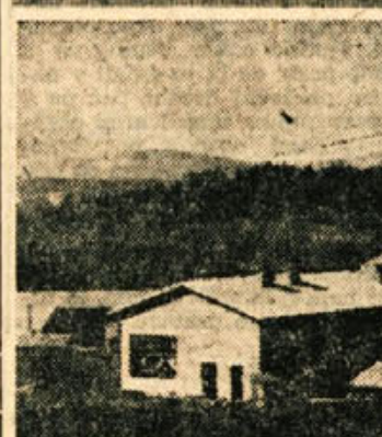
Gradilišče nove zadrudne mlekarne v Novem mestu je pred teden dni spet oživel. Letos bodo vsa glavna dela zaključena

V slovenskih časopisih, ki izhajajo v Inocerastvu, zlasti v časopisih ameriških Slovencev beremo večkrat poleg dopisov rojakov, ki so obiskali staro domovino, tudi poročila naših razmer, naše napore, težave in uspehe; vsaj velika večina skuša pojasniti rojakom in ostalim ljudem v zamejstvu politični in gospodarski položaj pri nas. Ljudje v svetu, ki se zanimajo za stanje v novi Jugoslaviji (in teh je zelo veliko), so hvaležni za vsako objektivno resnično poročilo. Toda med dopisniki časopisov v zamejstvu so tudi taki, ki skušajo prikazati neobveščeni ljudem v tujini razvečanemu pri nas iz čisto svojega osebnega gledišča, dostikrat iz osebno koristljubnih namenov ter političnega nasprotovanja. Pri takem prikazovanju razmer namerno potvarjajo resnico in se hočejo oprati pred ljudsko obojdo za svoje nedomoljubno delovanje med vojno. Samo en primer: