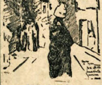
Motiv iz Kaira