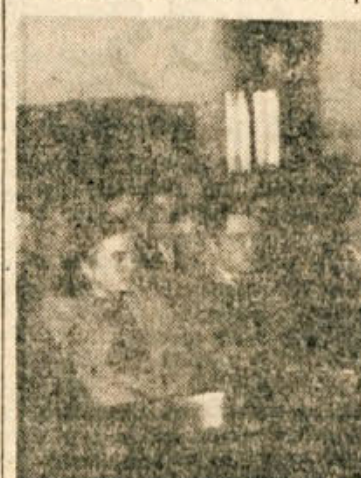
Udeleženci konference v Kočevju

videl na ulici po osmi uri zvečer, tisti dijaki, ki pa celo ponoči obkulejajo cerkev, ne dobijo nobenih ukorov (primer lanske polnočnice). Predlagali so tudi, naj bi bila organizacija