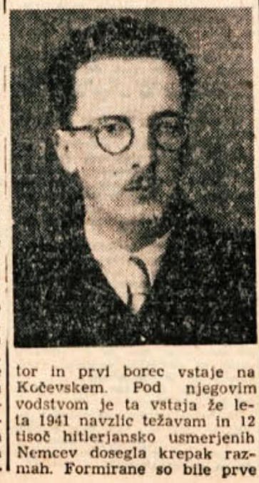
tor in prvi borec vstaje na Kočevskem. Pod njegovim vodstvom je ta vstaja že leta 1941 navzlic težavam in 12 tisoč hitlerjanskim usmerjenim Nemcem dosegla krepak razmah. Formirane so bile prve

ljal javno ljudstvom. Kar proti sovražniku na Kočevskem se je boril tudi proti Kulturbundu in klerikalnemu farizejstvu. Ob razpadu stare Jugoslavije je med prvimi sledil klicu Partije za borbo proti fašističnemu okupatorju in domačim izdajalcem. Bil je prvi organiza-