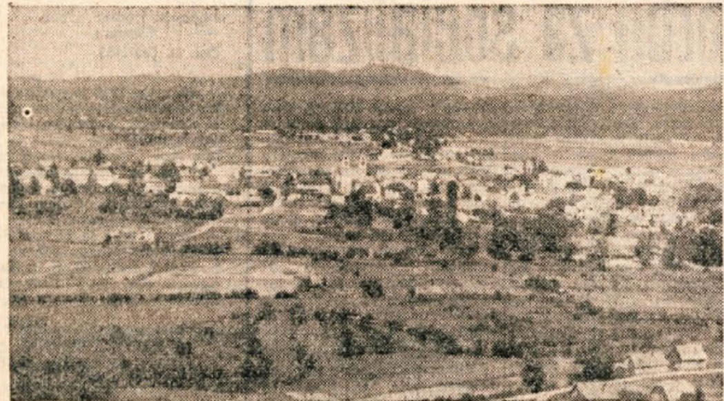
KOČEVJE — en sam spomenik naše revolucije — je v preteklem letu vstalo iz ruševin in je danes eno najpriznanišjih mest v Sloveniji

plavljajo, so Ribnica, Tržišnica in Blistrica v predelu Dolenja vas — Ribnica — Zlebič — Sodražica do Zimaric. Zlasti hitro se razlije voda po travnikih in celó njihvah pri Dolenji vasi. Vodne razmere tega predela bi bilo treba verjetno reševati v povezavi z Mokricami, to je zamočvirjeno področje pri gornjem toku Rinže. Izredno kratek tok, je nekaj sto metrov, ima Rakitnica. V velikolaškem predelu je treba omeniti predvsem Rašico in nekaj majhnih