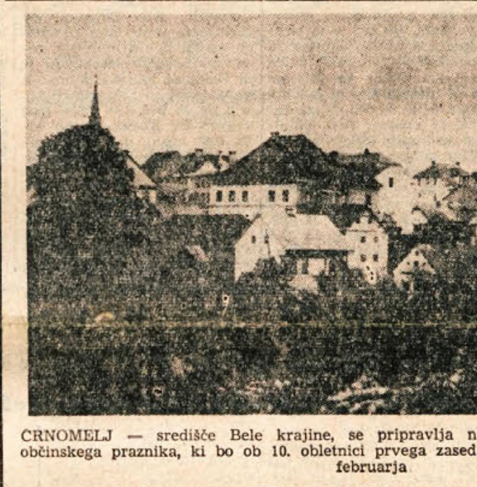
CRNOMELJ — središče Bele krajine, se pripravlja na slovesno prvo praznovanje občinskega praznika, ki bo ob 10. obletnici prvega zasedanja SNOS — letos 18. in 19. februarja