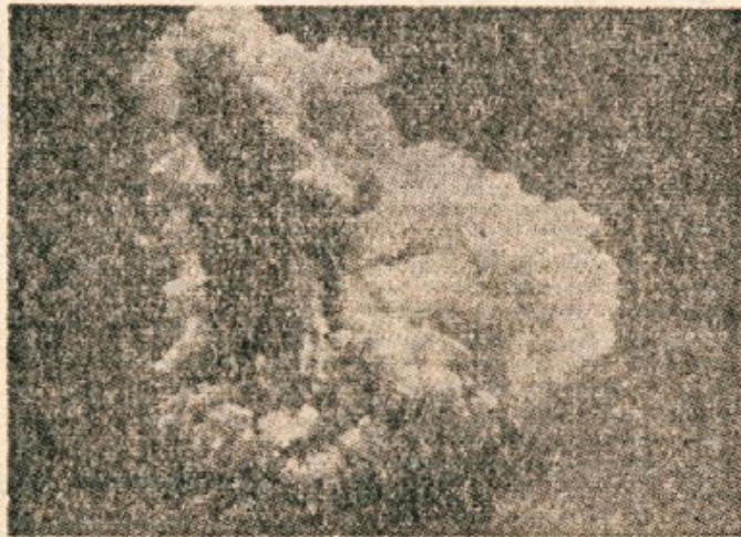
Vulkan Krakatau še bruhca

Krakatau je bil vulkanski otok, velik kakih 18 kvadratnih milj, na odprtem morju med Javo in Su-matro. V začetku pomladi leta 1883 so se na otoku začela po-javljati znamenja preteče nevar-nosti. Iz razpok v skalah je začel puhteti dim, pomešan s paro. Skozi džunglo sredi otoka je po-tekala pravcata reka lave. Kapitan Ferzenaar, ki se je bil v tem času izkrcal na otoku, je sporočil kolonialni upravi, da so tla Kra-katau postala vroča, da ga je peklo v noge, čeprav je imel de-bele podplate in da je dobil opek dva noga vulkana. Ta kapitan je bil zadnji beli človek na otoku pred katastrofo. Plovba v vodah okrog Krakatau je postala zelo nevarna. Morje je pokrivala de-bela plast pepela. Ni bilo dolgo, ko so na vzhodni obali Jave za-slišali bobnenje s Krakatau. V mestu Buitenzorg, ki je oddaljeno od Krakatau okrog 100 km, so ljudje iskali zaklonišč, misleč, da se bliža strahovit vihar. Eden od njih je takole popisal svoje vtise (100 km proč od Krakatau, na drugem otoku!):