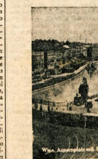
Dunaj — pogled na Aspern — trg s sedanjim ktnom Urania

nišesar ali pa obrnejo razgovor v drugo stran. Prepričani so, da so Avstrijci v drugi svetovni vojni najbolj trpeli. Lahko bi se in še naštevati razne nazore — vendar menim, da je to dovolj. Kljub takim mnenjem pa ven-