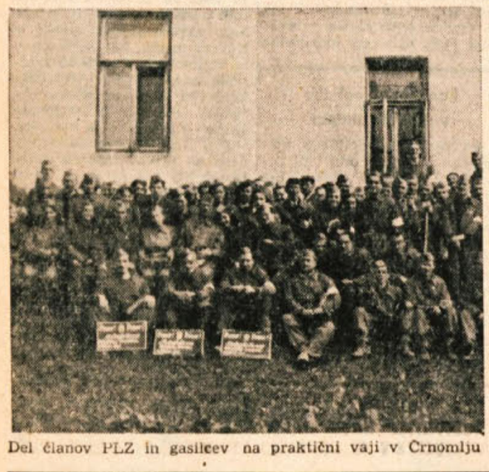
Del članov PLZ in gasilcev na praktični vaji v Črnomlju

Ob petletnici ustanovitve Protiletalske zaštite v naši državi, 27. decembra, je črnomlajska PLZ sklicala slavno svečo. Seje so se razen članov udeležili tudi mnogi gostje, predstavniki ljudskih odborov, množičnih organizacij,