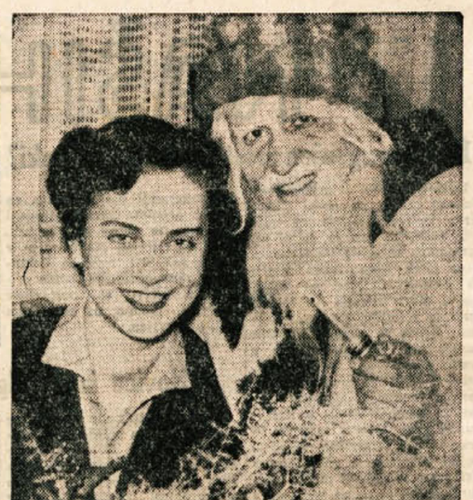
Vesna, ki se je ob novem letu po čudnem naključju srečala z Dedkom Mrazom v uredništvu Ljubljanskega Dnevnika, bo sredi februarja prišla tudi na platno novomeškega kina. Na novi slovenski celovečerni film že danes opozarjamo naše bralce in prijatelje filmske umetnosti.