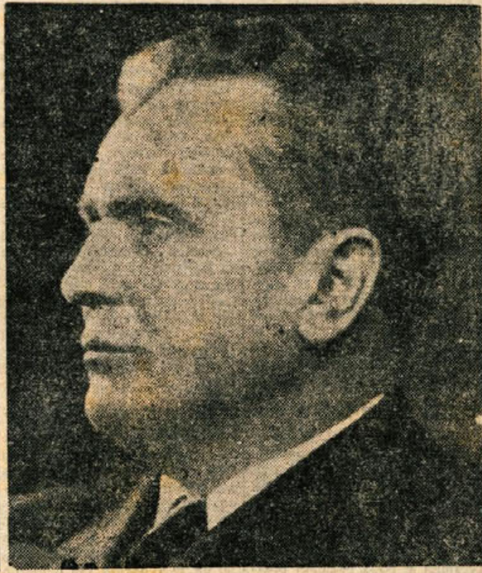
mi za zmago miru na svetu. Zrtve, ki smo jih doslej prispievali za to stvar, pa so do-

Tovariši in tovarišice, državljanji in državljanke! Upam, da se ne motim, ko pravim, da stopamo v nastopajočo 1954. leto v razveseljivejšem položaju, kakor v prejšnja poveljna leta. Na obzorju se čedalje bolj kažejo žarki luči, ki se sicer počasi, toda vztrajno prebijajo skozi temne oblake, viseče nad človeštvom. Zmaga miru nad vojno nevarnostjo, pred katero je ves miroljubni svet trepetal v povojnih letih, je čedalje manj ogrožena, vsaj v bližnji bodočnosti, od najboljših odgovornih ljudi na svetu pa je odvrisno, ali bo ta nevarnost tudi v daljni bodočnosti odstranjena. Ni pa odvrisno samo od odgovornih državljanov, marveč tudi od miroljubnih sil na svetu sploh in v vsaki deželi posebej, ali bo mir zagotavljen za daljšo dobo, če še ni možno, da bi ta ideal človeštva dosegli za vselej.