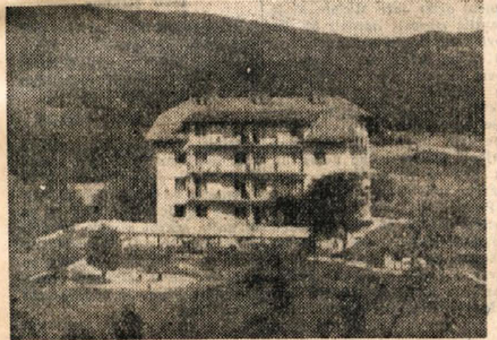
Hotel Smarješke toplice

Občinski ljudski odbor je tudi sklenil uvesti pasjo takso po 500 din od psa - čuvaja, razen tistih, katerih lastniki žive na smott. Oddal je tudi precej zemljišča v najem in lma od tega izredne dohodka. Poleg tega je še vse polno drugih problemov in zadev, o katerih se bi bilo potrebno pogovoriti z volivci. Dosedanje delo obč. LO kaže, da ta ni šel po poti prave ljudske demokracije, pač pa nekam v nasprotju smer preko zakonitih določil, ki jih pa ljudje dobro poznajo. Čas je, da dosedanje pomanjrljivosti popravljamo in izboljšujemo. S. S.