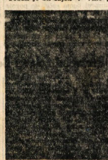
Tobak (sorta burley) na okrajnem posestvu v Okljuku

Za letošnje poskusno gojitev tobaka je bila dala Tobačna tovarna v Ljubljani semena od 10 vrst cigarnega in cigaretnega tobaka, da se ugotovi, katera vrsta tobaka bo tukajšnjim zemlji ustrejala.