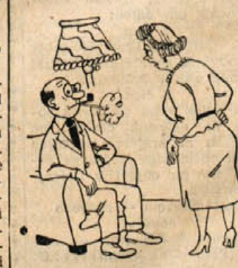
»Prav prijeto sva kramljala, dokler nisi ti odprl us!«

»To je vse v redu, ampak kdo bo plačal moji delavnico, ki jo je podrla vaša žena?«