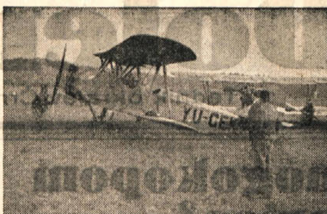
Motorno letalo, last novomeškega aerokluba

Temeljite priloge dajo slutiti, da bo letošnja Novoletna jelka pravo presenečenje za naše malčke. Kaj vse pripravila Dedek Mrz, za ne povemo, bomo drugič.