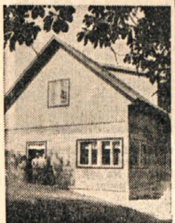
Kostelčani imajo tudi lep planinski dom na Kostelu ob Kolpi (postavljen letos)