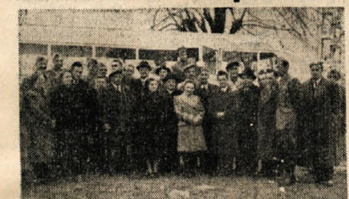
Delegacija iz Novega mesta, ki je obiskala naše borce na položaju

Ve nekaj dni pred praznikom Dneva republike so novomeški delovni kolektivi in ustanove na pobudo Mestnega odbora SZDL začeli zbirati darila, ki so jih namenili za JLA. Na dan pred 29. novembrom je bilo na Mestnem odboru SZDL že cel kup daril, med njimi 30 komadov žog za nogomet in odbojko, 33 garnitur šaha, 2 mreži za odbojko, garnitura namiznega tenisa. Dalje so kolektivni podarili 20 knjig Vladimira Dedijera »Josip Broz-Tito«, ter 80 raznih drugih knjig. Poleg tega je bilo zbranih tudi mnogo cigare. Skupna vrednost vseh daril, ki so jih zbrali kolektivni Novo mesta je 212.100 dinarjev.