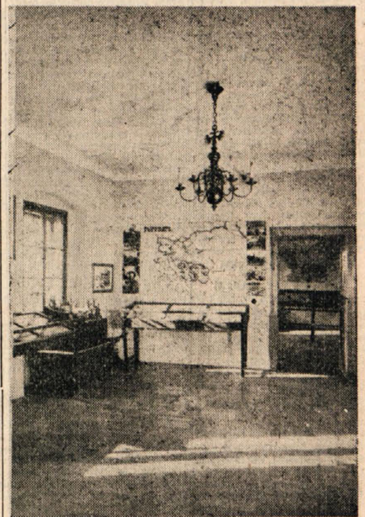
Pogled v oddelek NOB